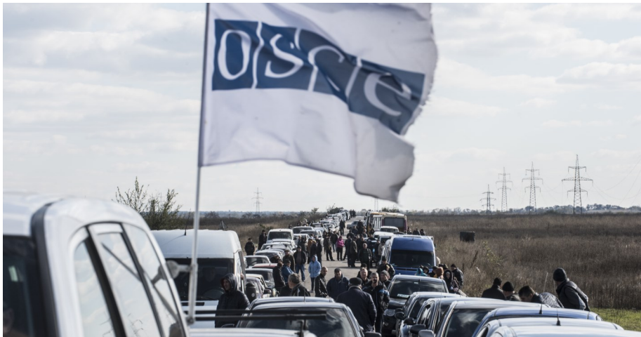
Мирні жителі чекають у черзі на контрольному пункті в'їзду-виїзду біля Мар'їнки, Донецька область, вересень 2016 року.