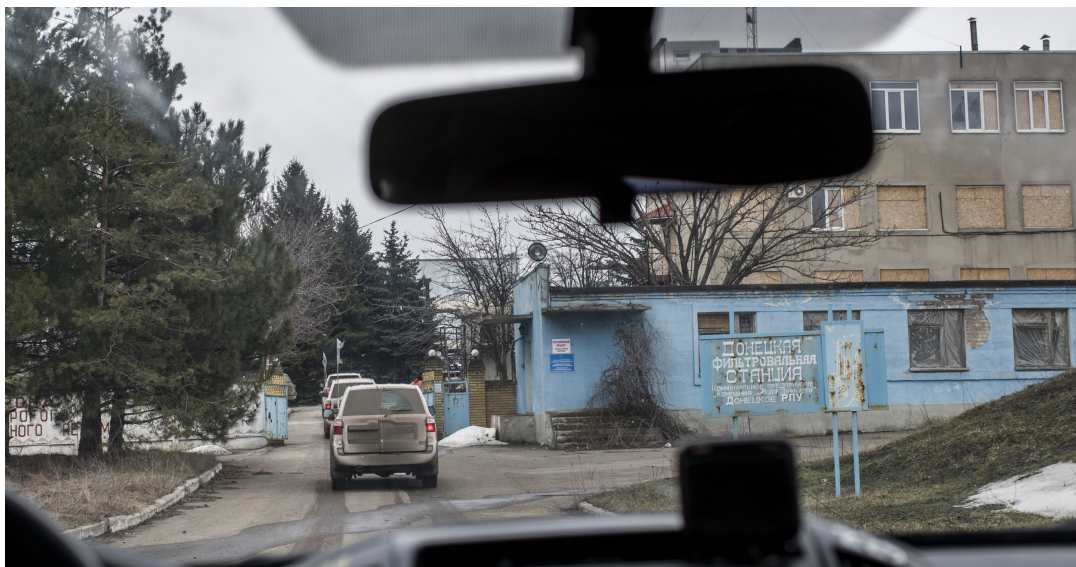
Патрулирование СММ ОБСЕ на Донецкой фильтровальной станции, 2018 г.