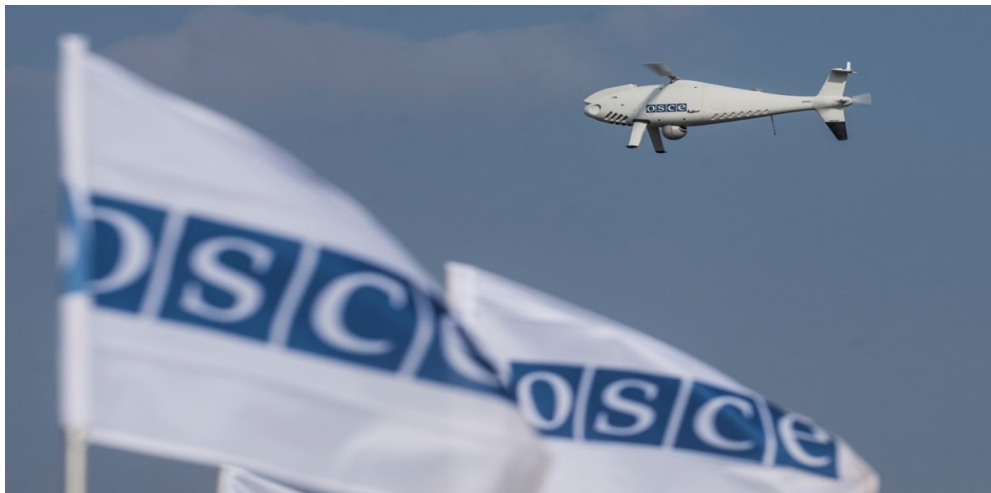
Беспилотный летательный аппарат СММ дальнего радиуса действия