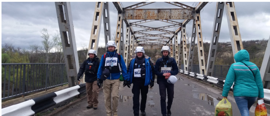
Наблюдатели СММ и мирная жительница пересекают мост через Северский Донец в Станице Луганской, апрель 2017 года