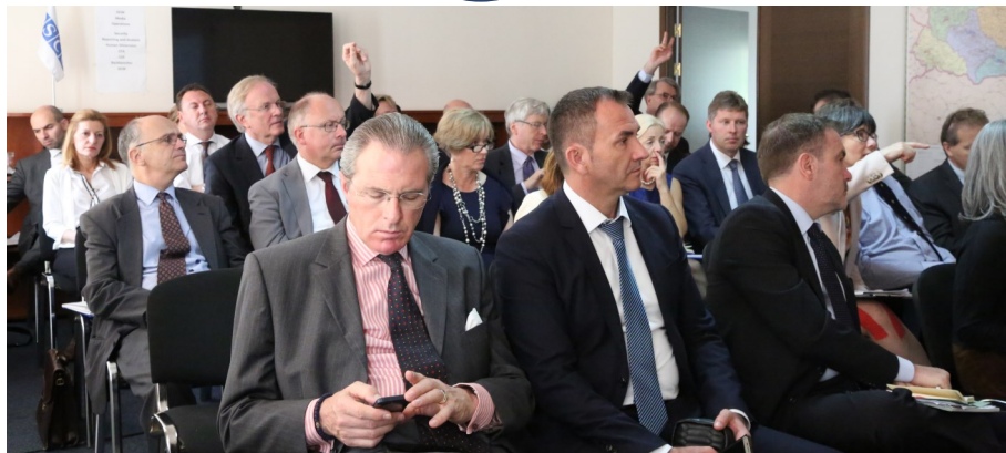
СММ приймає 27 послів ОБСЄ у Києві, 29 травня 2017 р.