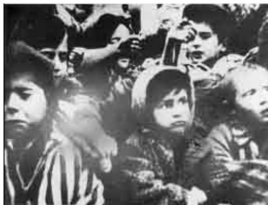
Vaikai iš koncentracijos stovyklos tiesia rankas, pasitikdami išlaisvintojus, Osvencimas, Lenkija (Jad Vashem)