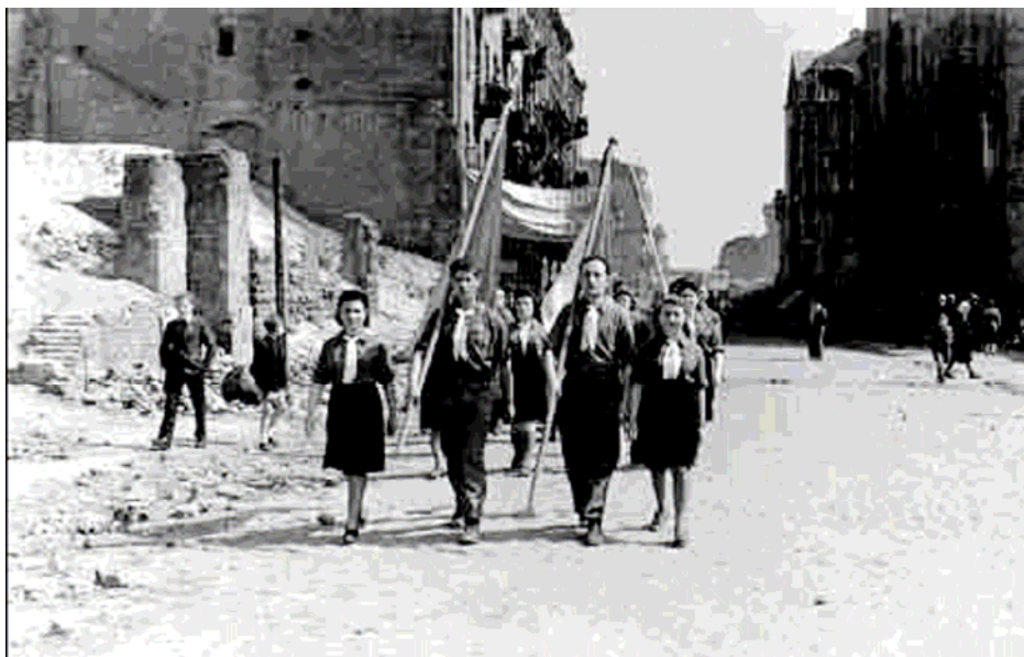
Lenkija, Varšuva, po karo. Memorialinis maršas, skirtas Holokausto aukų atminimui.

Kai kuriose šalyse Holokausto aukų atminimo diena egzistuoja jau seniai, kitose – tai nauja tradicija. Minėdamos šią dieną, valstybės organizuoja oficialias ceremonijas ir specialius parlamento posėdžius. Šie renginiai plačiai nušviečiami vietinėje, valstybinėje bei tarptautinėje spaudoje.