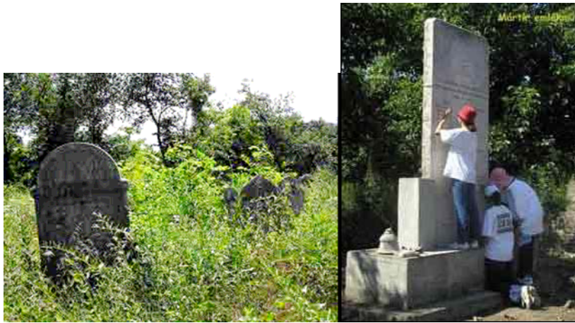
Mok slėiviai tvarko apleistas žydų kapines Zcobe, Vengrija, 2002. (Budapešto "Lauder Javne" žydų mokykla)

Vengrijos sostinės Budapešto "Lauder Javne" mokykla organizuoja vasaros programas mokiniams, kurių metu jie tvarko apleistas žydų kapines. Savaitę moksleiviai tvarko kapines ir atstato nuverstus antkapius. Jie taip pat bando atstatyti ir iššifruoti antkapių užrašus ir stengiasi atkurti kadaise šioje vietovėje egzistavusios žydų bendruomenės istoriją. Programos pabaigoje mokiniai pamini visus tuos, kurie žuvo Holokausto metu, kuomet buvo sunaikinta klestėjusi iki karo žydų bendruomenė. Projekte taip pat dalyvauja kai kurios vietinės mokyklos ir savivaldybės.