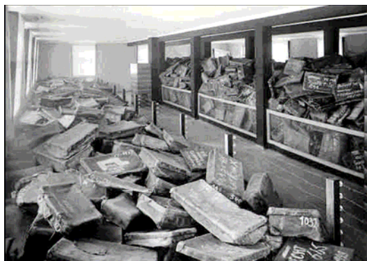
Osvencimas, Lenkija, po karo. Lagaminai muziejuje, Jad Vashem.

Norvegijos pradinio ir pagrindinio išsilavinimo Departamentas skatina visas mokyklas organizuoti renginius, skirtus Holokausto aukoms atminti. Mokykloms pateikiama visa reikalinga medžiaga tam skirtame specialiaame interneto puslapyje. Daugelis mokyklų organizuoja poezijos vakarus, parodas, skirtas Holokaustui. Kitos mokyklos rengia memorialines eisenas su deglais. Jie kviečia į eisenas Holokausto liudininkus, tuos, kas išgyveno, prašydami juos papasakoti apie savo asmeninius išgyvenimus.