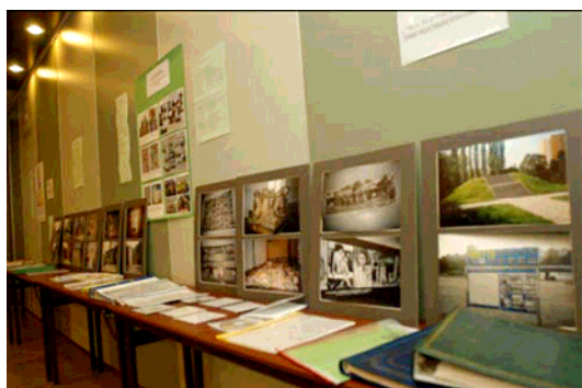
Moksleivių darbų paroda konferencijoje "Gyva Lietuvos žydų istorija". 2004 metų rugsėjo 23 – Holokausto aukų Atminimo diena Lietuvoje.

Svarbu atkreipti dėmesį į projektus, susijusius su krašto istorija. Tai padės mokiniams pajusti ryšį su jų gimtinės istorija. Tyrinėdami savo krašto istoriją, mokiniai gali sužinoti, kokią vaidmenį prieškarinės Europos istorijoje vaidino vietinės žydų bendruomenės. Taip pat jie gali sužinoti, kaip palaiapsniui buvo apribojamos vietinių žydų teisės, kol galų gale jie buvo deportuoti ir išžudyti mirties stovyklose. Viena Varšuvos mokyklų organizavo didelį projektą, skirtą Holokausto aukoms atminti. Darbas tęsėsi visus metus, o jo kulminacija tapo Holokausto aukų Atminimo dienos pravedimas balandžio 19 dieną – Varšuvos geto sukilimo pradžios metinių dieną. Mokiniai parengė parodą apie Varšuvos getą. Jie atrinko medžiagą ir suformavo standus apie atmintinas vietas, kurios yra netoli jų mokyklų (pvz., Varšuvos geto paminklas ir Umschlagplatz – žydų deportavimo į mirties stovyklas vieta). Jie taip pat parengė stendą, skirtą visoms kadaise buvusioms mieste sinagogoms.