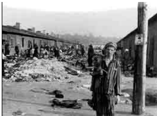
Buęs koncentracijos stovyklos kalinys prie barakų, Bergen-Belzen, Vokietija

Atminimo dienos proga mokytoja gali organizuoti susitikimą su Holokausto liudininkais (ypač su tais, kam pavyko išgyventi, su koncentracijos stovyklą vadavusiais žmonėmis, aukų gelbėtojais). Liudininkų parodymai padeda mokiniams susidaryti aiškesnį įspūdį. Be to, labai sėkmingai galima panaudoti iš anksto parengtus video įrašus – "istorija per veikėjų paveikslus".