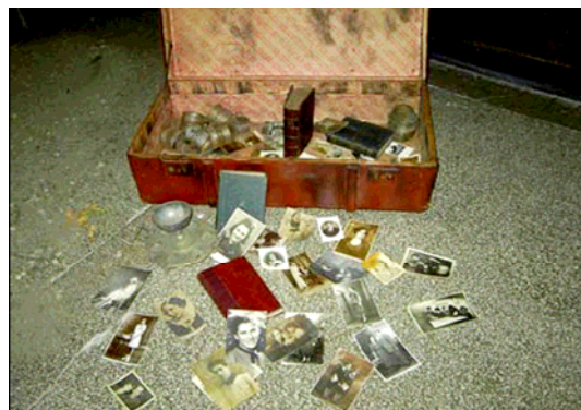
Šis lagaminas pademonstruotas parodoje, skirtoje Holokausto Aukoms atminti. Jį sukūrė Rumunijos Vlaiku Vode Nacionalinio koledžo Atminties klubo nariai. 2004 m. spalio.