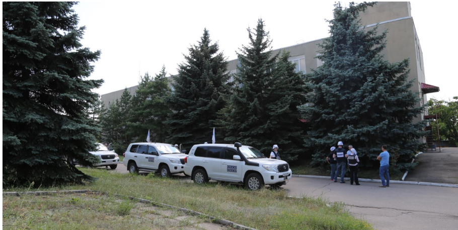
Патруль СММ на Донецькій фільтрувальній станції, що розташована між Авдіїкою та Ясинуватою, 21 липня 2017 року