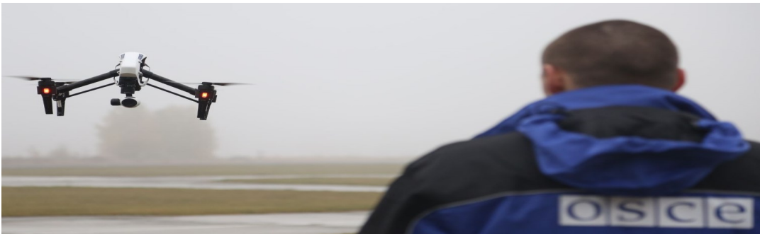
Наблюдатель СММ управляет полетом БПЛА