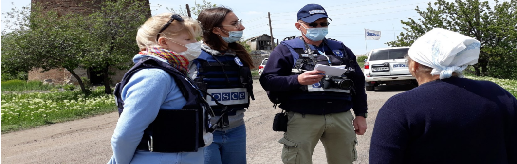
Спостерігачі спілкуються з жінкою у Старогнатівці Донецької області