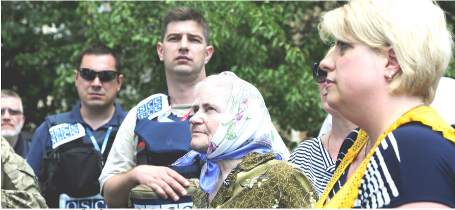
Наблюдатели СММ общаются с мирными жителями Красногоровки, Донецкая область, 21 июня 2017 года