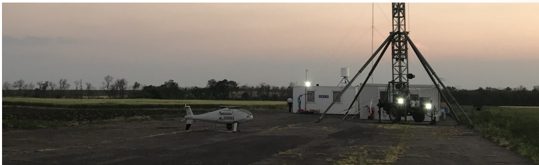
База БПЛА СММ дальнього радіуса дії у Степанівці (ОБСЄ)