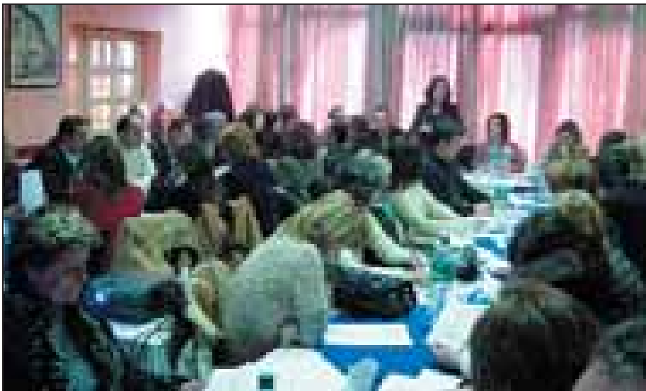
Sesioni i Trajnimit të Trajnerëve për dhunën në familje, organizuar nga zyra e OSBE-së në Gjilan

Problemi i trafikimit me qenie njerëzore dhe dhunës në familje është mjaft brengosës në Evropën Juglindore. Gjersa dhuna në familje ka ekzistuar historikisht, çështja e trafikimit të qenieve njerëzore është diçka e re në Kosovë. Pas konfliktit të vitit 1999, Kosova kryesisht ishte vend i destinacionit të trafikimit të viktimave të moshës madhore dhe asaj të mitur. Kohët e fundit janë duke u regjistruar edhe rastet e trafikimit të grave dhe fëmijëve nga Kosova.