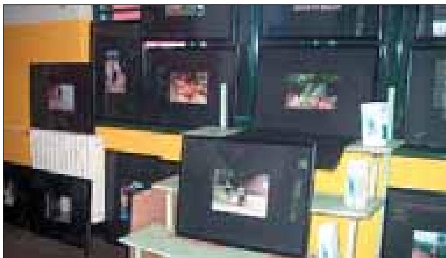
Ekspozita e fotografive të personave me nevoja të veçanta organizuar në gjimnazin 'Gjon Buzuku' në Prizren

OSBE-ja financiarisht ka mbështetur shtypjen dhe shpërndarjen e 2.000 udhëzuesve për mësues dhe 10.000 fletore pune për nxënës, të cilat konsiderohen si të mjaftueshme për dy vitet e adhsme. Gjithashtu, para fillimit të vitit shkollor 2005-2006 arsimtarëve të këtij niveli mësimor do t'u ofrohet trajnim dhe monitorim adekuat në mësimdhënie, për t'u ndihmuar në dhënjen e një edukimi sa më