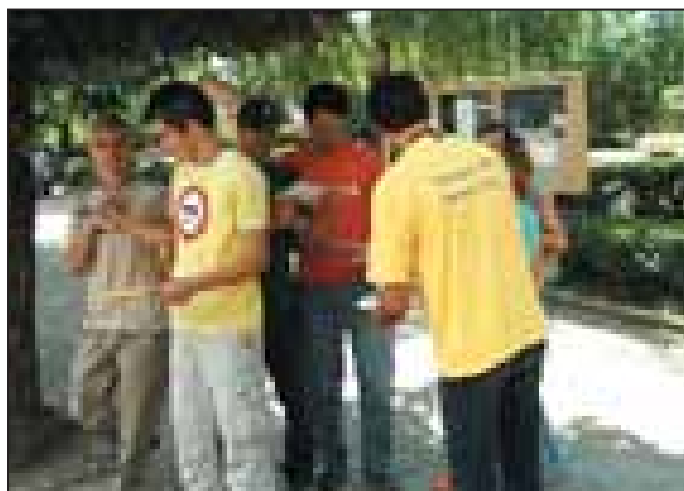
Rrjeti i të rinjëve nga Peja duke shpërndarë fletushka në qytetin e Pejës.

Rrjeti i të rinjëve të Pejës (RrRP) u formua në prill të vitit 2002 me iniciativën e marrë nga zyra regionale e OSBE-së në Pejë. Vlen të theksohet se dëshira e madhe për themelimin e këtij rrjeti ishte edhe në mesin e shtatë anëtarëve të qendrave dhe OJQ-të rinore të komunës së Pejës të cilat edhe janë themeluesë të këtij rrjeti.