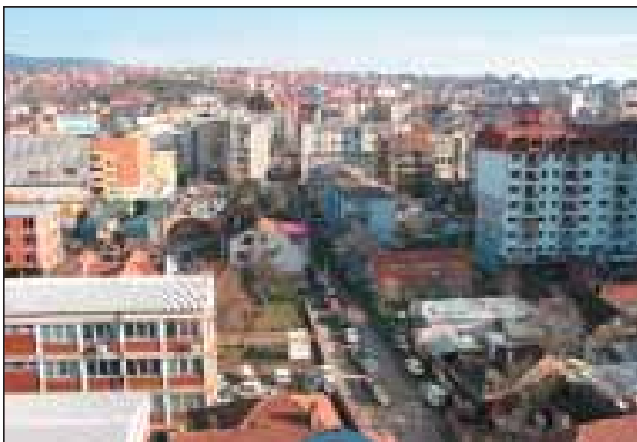
Prona është problem në tërë Kosovën, Prishtina nuk bën përjashtim si kryeqytet

Standardi mbi të drejtat pronësore është përpiluar për të ndërtuar në mënyrë strategjike një sistem funksional të të drejtave të njeriut që do të merrte parasysh dhe do të lëvizte drejt zgjidhjes së të gjitha të metave të lartpërmendura. Për ta bërë këtë, Standardi