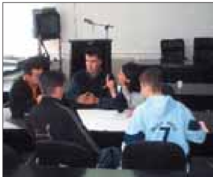
Një grup tjetër i Rrjetit të të rinjëve të Pejës gjatë një trajnimi

"Për të mbajtur shënime të punës së tyre dhe për të mësuar nga përvojat e akumuluar, Rrjeti Rinor i Pejës do të përpiloj raportin përfundimtar vjetor në formë të një doracakut, ku do të paraqitet e gjithë puna e bërë gjatë vitit 2005 e që mund të përdoret edhe nga rrjetet tjera rinore", përfundon Latifi.