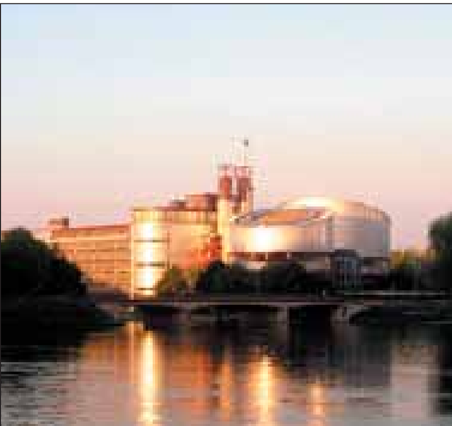
Gjykata evropiane për të drejtat e njeriut me seli në Strasbourg të Francës

Si të tilla, Institucionet e Përkohëshme Vetëqeverisëse, edhe pse nuk janë nënshkruese të Konventës Evropiane për të Drejtat e Njeriut, janë të obliguara të veprojnë në përputhje me të. Nën nenin 3.2(b) të kornizës,