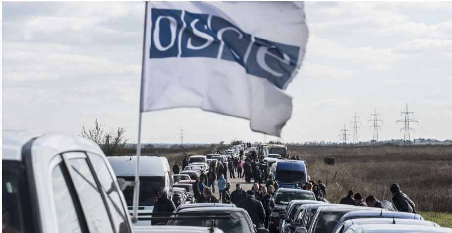
Мирные жители ожидают в очереди на контрольном пункте въезда-выезда возле Мариуполя, Донецкая область, октябрь 2016 года.