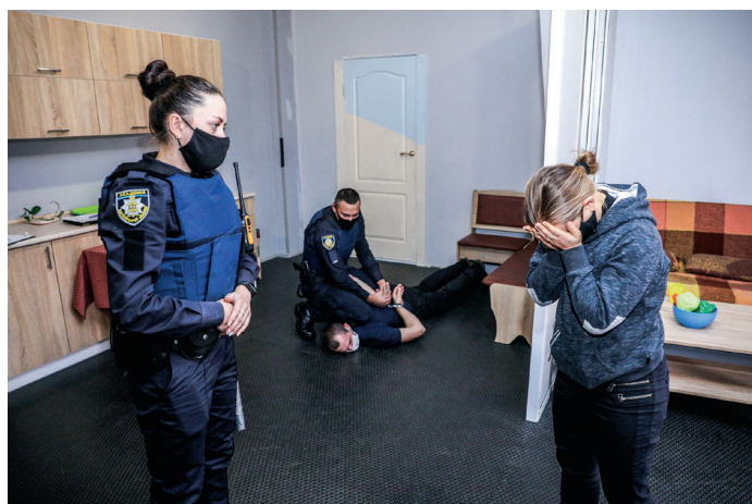
Курсанти Національної Академії Поліції в Києві використовують обладнану ОБСЄ навчальну кімнату для того, щоб навчитися працювати з викликами, пов'язаними з домашнім насильством. 4 грудня 2020р.