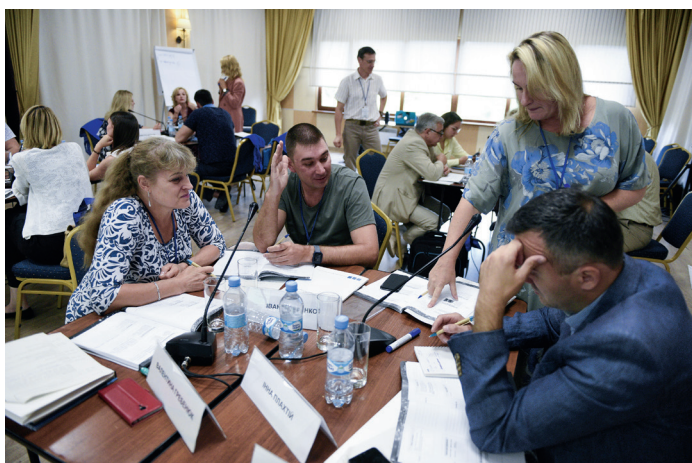
Судді вчаться просувати серед колег гендерної чутливості на тренінгу, організованому Координатором проектів ОБСЄ поблизу Києва 11 липня 2019р.

У відповідь на виклики, пов'язані з конфліктом, Координатор допомагає в розробці системи соціальної підтримки психологічної реабілітації, онлайн-інструментів для спрощення доступу до цих послуг та допомоги учасникам бойових дій та членам їхніх родин.