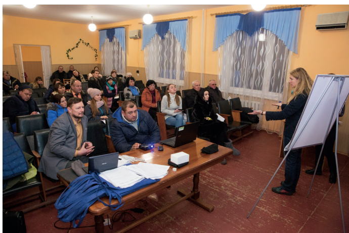
Активісти громадянського суспільства за підтримки ОБСЄ роз'яснюють зміни в системі урядування на зустрічі у Полтавській області напередодні перших виборів у новостворених громадах. 11 грудня 2018 року.

Координатор проектів ОБСЄ в Україні був утворений Постійною Радою ОБСЄ 1 червня 1999 року. Координатор проектів ОБСЄ замінив Місію ОБСЄ в Україні, яка працювала з 1994 до 1999 року.