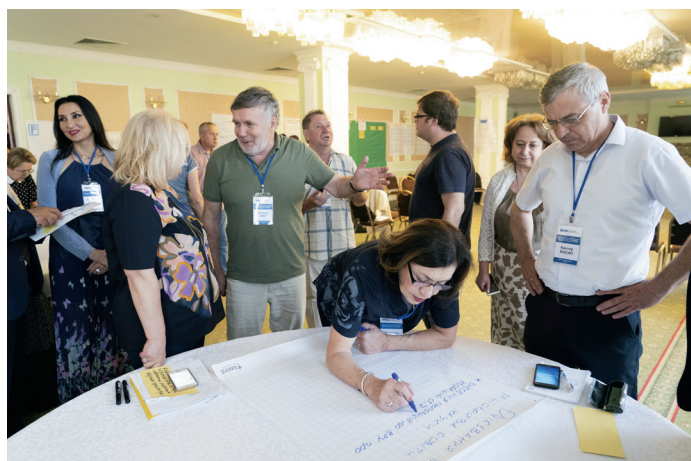
Діалог про вплив змін у законодавстві на освіту мовами меншин на заході, організованому Координатором проектів ОБСЄ в Києві, 29 травня 2019 року.