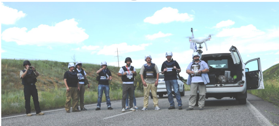
Спостерігачі СММ запускають БПЛА, який виявив значний витік на Південнодонбаському водогоні, 23 червня 2017 р.