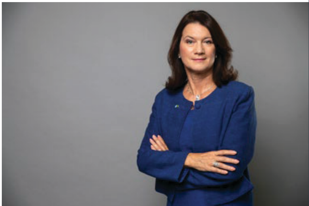
Kryesuesja e Radhës, Ministria e Punëve të Jashtme, Ann Linde.

Emëruesi i përbashkët i gjithë këtyre sfidave është sa vijon: ato mund të zgjidhen vetëm në mënyrë të qëndrueshme përmes bashkëpunimit ndërkombëtar. Kështu, një platformë shumëpalëshe, siç është OSBE-ja, është jashtëzakonisht e rëndësishme. Tanimë ka ardhur koha që t'i "kthehemi çështjeve