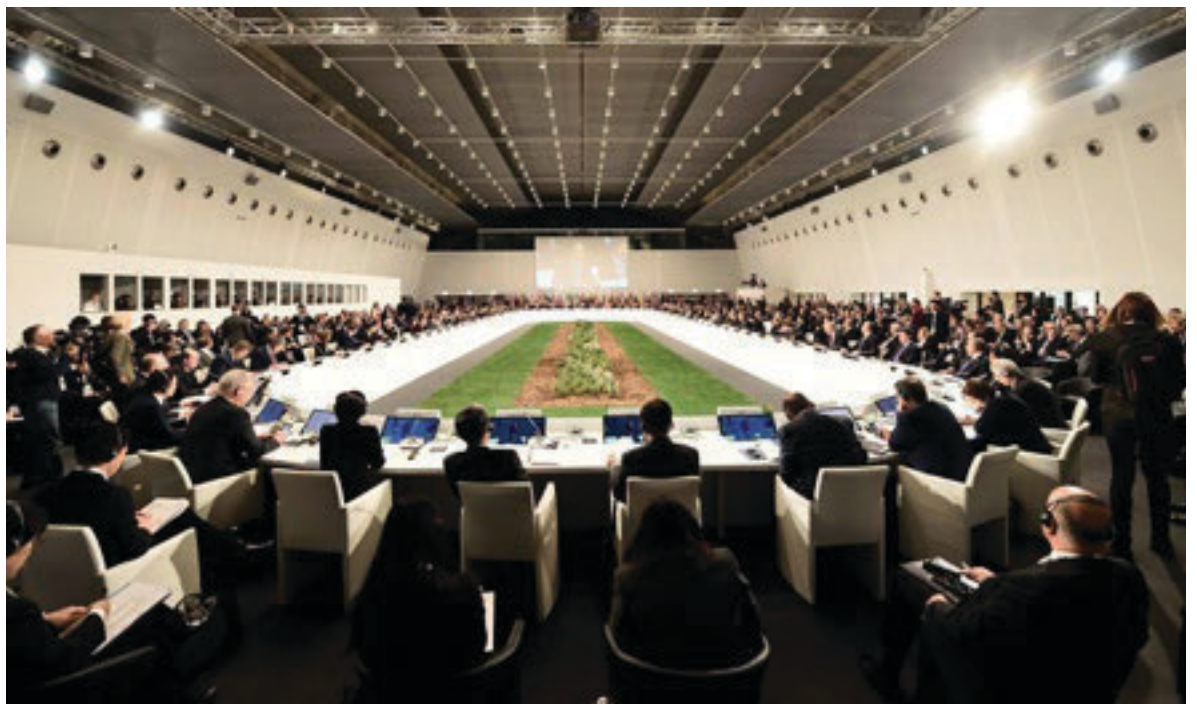
Pjesëmarrësit gjatë seancës hapëse të Këshillit të 25-të të Ministrave të OSBE-së, të mbajtur në Milano më 6 dhjetor 2018.

MNBS-të duhet po ashtu t'u përshtaten ndryshimeve të rrethanave. Si kryesues, ne do të vazhdojmë të mbështesim diskutimet lidhur me propozimin për modernizimin e Dokumentit të Vjenës me qëllim të rritjes së transparencës dhe parashikueshmërisë, si dhe forcimit të besimit midis shteteve për çështjet ushtarake. Ne e shohim Dialogun e Strukturuar si një platformë me rëndësi për dhënie të kontributit në këto diskutime.