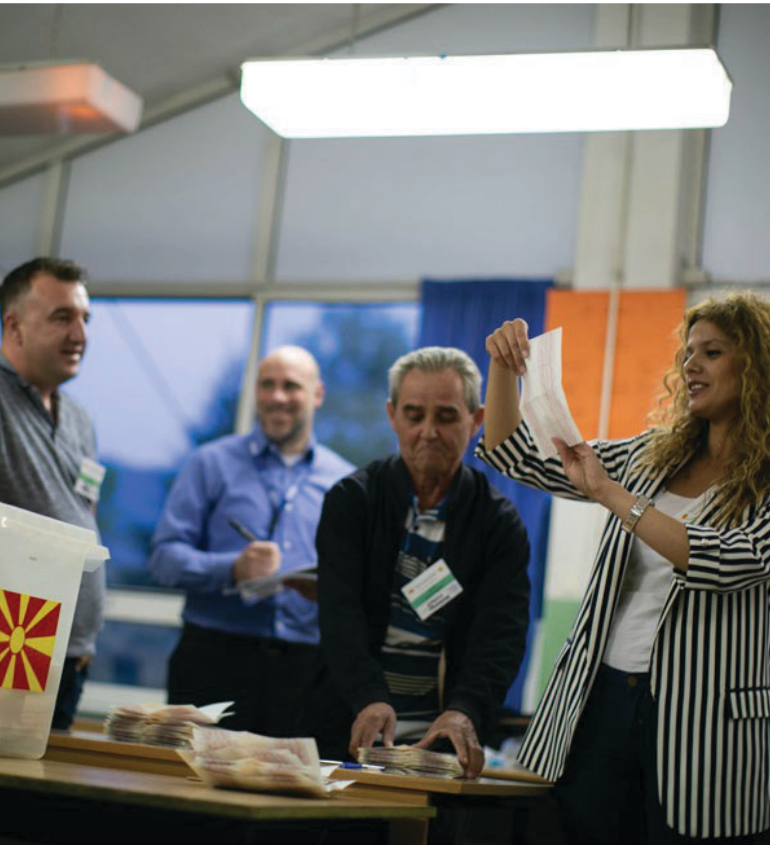
Vëzhguesit e zgjedhjeve gjatë zgjedhjeve presidenciale në Maqedoninë e Veriut, Shkup, 5 maj 2019.