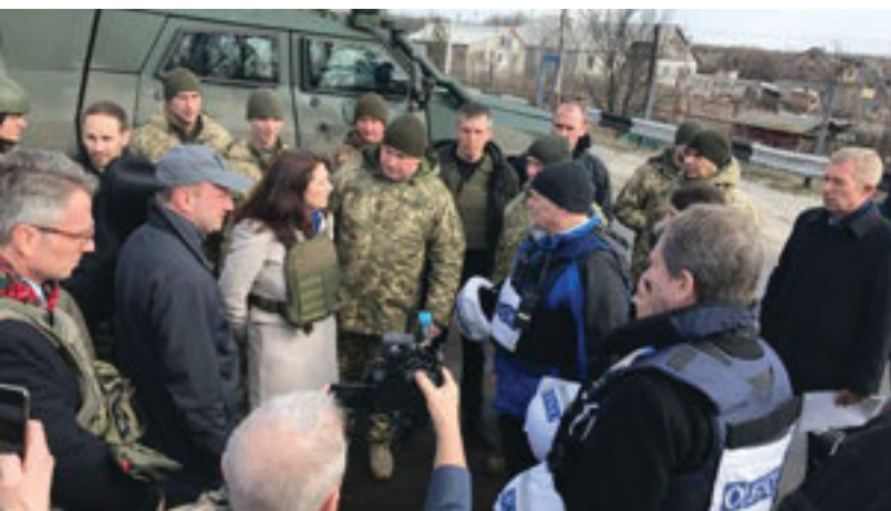
Ministria e Jashtme Ann Linde si Kryesuesja e ardhshme pranë urës mbi vijën e kontaktit në Stanytsia Luhanska në Ukrainën lindore, 3 Mars 2020.