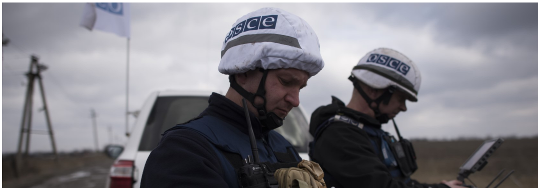
Наблюдатели СММ патрулируют у Оленовки, в Донецкой области