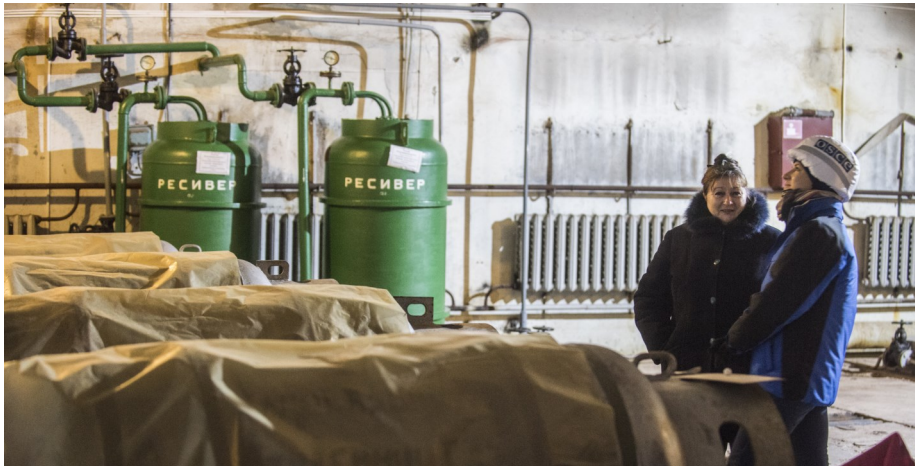
Наблюдатели ОБСЕ на Донецкой фильтровальной станции