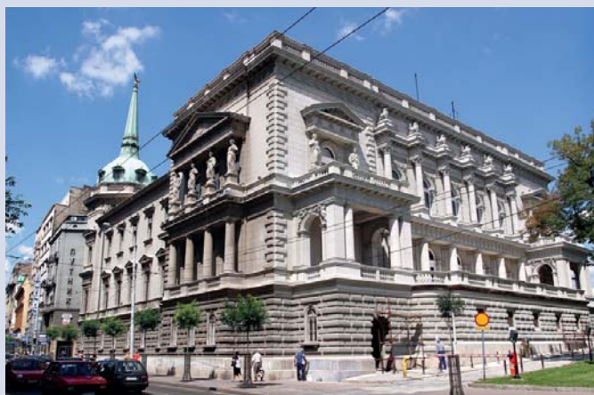
Скупштина града Београда – Стари двор

Стари двор је замишљен као једносратна грађевина правилне четворougаоне основе, чији је угао према