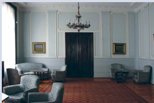
Салон у приземљу

Нови двор је био званична резиденција краља Александра Карађорђевића од 1922. до 1933. године, након чега је према краљевој жељи Двор уступљен Народном музеју, који се уселио у овај простор у јуну месецу 1934. године. Збирке музеја налазиле су се у Новом