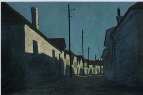
Б. Карлаварић, „Улица у Сремским Карловцима“

М. Поповића, С. Ђелића Д. Цигарчића, Ф. Слане, Ђ. Бошана, М. Курник, Ј. Сокић, С. Шохаја, М. Прегеља, Б. Продановића,