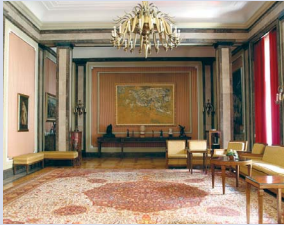
Жути салон партије и фасаде према Булевару краља Александра.

Данас, унутрашњост Двора красе бројна дела домаћих сликара и вајара. У Црвеном салону налази се факсимил најстаријег познатог записа у којем се помиње словенско име Београда, у писму папе Јована VIII бугарском кнезу Борису. Оригинал документа, од 16. априла 878, чува се у ватиканској архиви. У овом салону изложен је и Орден народног хероја, којим је Београд одликован 20. октобра 1974.