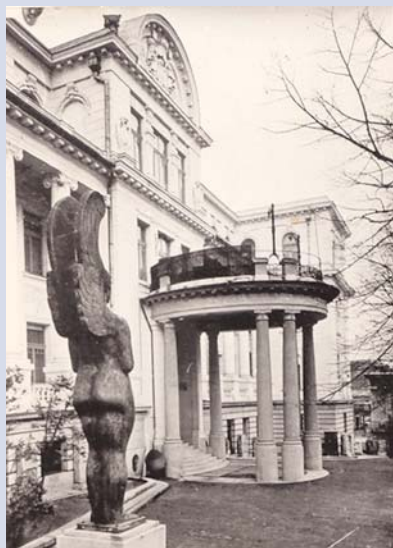
Нови двор – историјски изглед

двору све до 1948. године, када је зграда уступљена Извршном већу Србије.