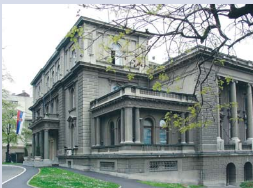
Зграда председника Републике – Нови двор

од 1950. користили су Извршно веће Србије, Скупштина Србије, Председништво Србије и најдуже председник Републике Србије са пратећим службама.