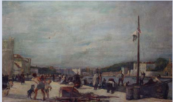
М. Поповић, „Лука у Загру“

► Унутрашњост некадашњег Новог двора, потом и музеја, који користи председник Србије, украшена је остварењима познатих аутора. Токове између два