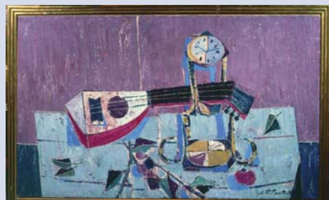
Миодраг Б. Протић „Мртва природа са манголином“