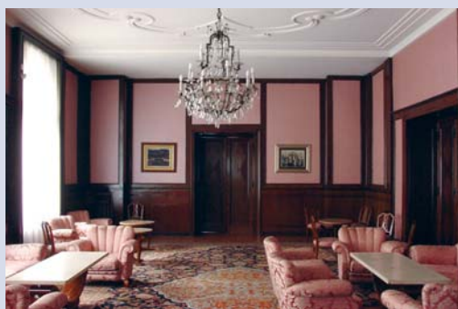
Салон у приземљу

Зграда је подигнута према пројекту познатог београдског архитекте