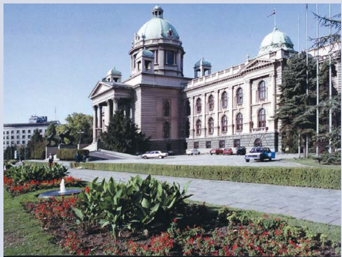
Зграда Дома Народне скупштине