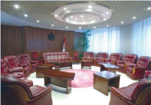
Салон при Кабинету председника

осталим просторима издвајају се салон при Кабинету председника, ВИП салон, скупштински ресторан, као и 160 канцеларија за народне посланике и запослене у Служби Народне скупштине.