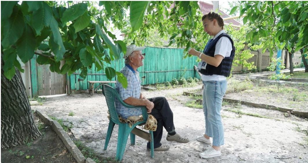
Співробітниця СММ спілкується з місцевим жителем Ясинуватої, Донецької області.