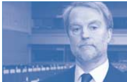
Посол Алекси Харконен с 14 октября 2002 года занимает должность руководителя постоянного представительства Финляндии

24 января Генеральный секретарь встретился с министром иностранных дел Австрии Бенитой Ферреро-Вальднер, главным образом для того, чтобы обсудить вопрос о выполнении Решения То. 9, принятого на встрече Совета министров в Порту в декабре 2002 года. Согласно этому решению австрийское правительство предоставляет расположенное в центре Вены здание по адресу Вальнерштрассе 6/ба