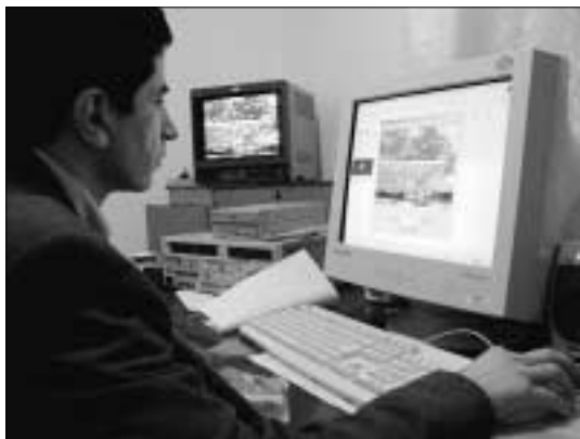
Эта душанбинская телекомпания ожидает получения лицензии на вещание

ОБСЕ обязательствами в отношении СМИ и с международными стандартами, в то время как другие законы либо носят нечеткий характер, либо попросту отсутствуют.