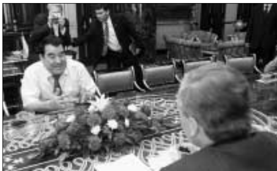
Сохранять каналы связи: президент Туркменистана Сапармурат Ниязов и Действующий председатель Яап де Хооп Схеффер.

Президент заявил на это, что принятие новых законов связано с угрозой терроризма, которая стала ощущаться в стране после попытки покушения.