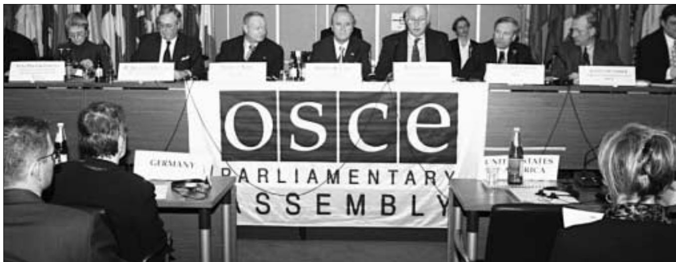
В зимней сессии ПА 20–21 февраля приняли участие около 250 парламентариев.

Одним из самых важных событий в ходе зимней сессии Парламентской ассамблеи (ПА) в Вене стала состоявшаяся 21 февраля специальная дискуссия о положении вокруг Ирака. Это был первый случай обсуждения Парламентской ассамблеей текущего международного кризиса, продемонстрировавший ее значение как форума для межпарламентского диалога. Тема Ирака была включена в повестку решением Постоянного комитета ПА, принятым по рекомендации Председателя Ассамблеи Брюса Джорджа.