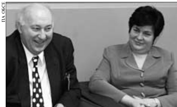
Председатель ПА Брюс Джордж и спикер молдавского парламента Евгения Остапчук на зимней сессии ПА

По приглашению парламента Казахстана и во взаимодействии с Программой развития ООН (ПРООН) 7–9