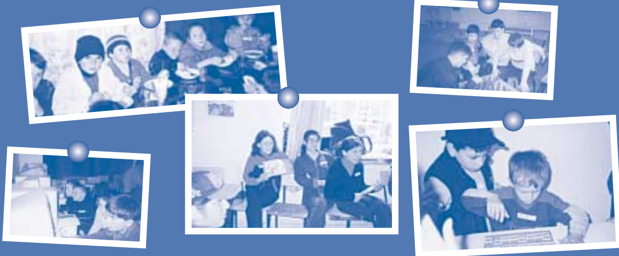
Тбилиси, Грузия: средства, собранные благодаря балу ОБСЕ 2002 года, позволяют оказывать материальную, медицинскую и психологическую помощь более чем 100 детям, семьи которых лишились жилища в результате землетрясения

Бал ОБСЕ 2003 года, на который собрались почти 1200 гостей и который состоялся 7 февраля в великолепных помещениях императорского дворца «Хофбург», – Фестзале, Церемониальном зале и Меттернихском зале – побил все рекорды. В соответствии с традицией собранные в этом году средства (почти 30 000 евро) будут пожертвованы на благотворительные цели, которые предстоит определить в ближайшие месяцы.