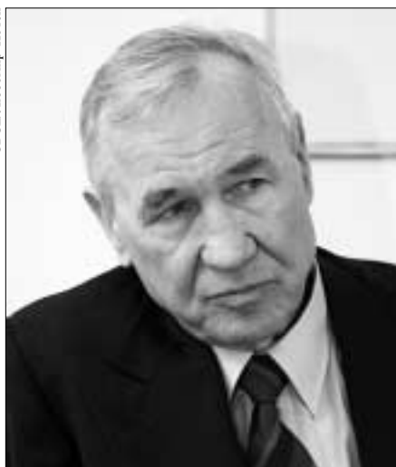
Казахстанские судьи и журналисты расширяют свои познания в вопросе о диффамации