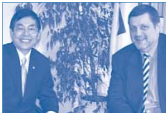
Посол Тайланда Сомкиати Арияпручья, вступивший в должность 22 января, на встрече с Генеральным секретарем

Посетите веб-сайт нидерландского Председательства в 2003 году: