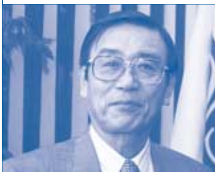
Хироси Хасимото назначен послом Японии с 25 февраля