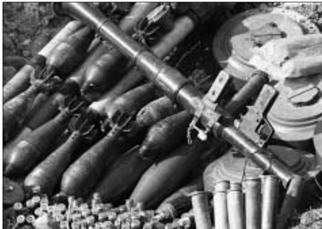
Ожидается, что на уничтожение находящихся на складах в Грузии боеприпасов потребуются несколько лет

Состоявшийся 27–28 февраля в Алма-Ате семинар способствовал уг-