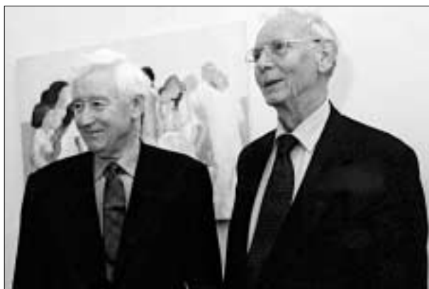
Нынешний Верховный комиссар по делам национальных меньшинств, шведский посол Рольф Экеус (слева), со своим предшественником Максом ван дер Стулом (Нидерланды).

На следующий день, 1 февраля, нынешний Верховный комиссар Рольф Экеус собрал в Гааге группу специалистов по предотвращению конфликтов, межэтническим отношениям и правам меньшинств для проведения открытого и конструктивного неформального диалога на тему «Предотвращение конфликтов путем интеграции в условиях многообразия». На этом семинаре, проходившем при поддержке нидерландского министерства иностранных дел, были рассмотрены потенциальные проблемы меньшинств в регионе ОБСЕ, новые вопросы такого рода, возникающие на все более об-