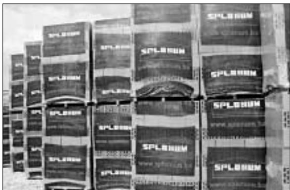
«Сплонум» – одна из нескольких компаний в Боснии и Герцеговине, согласившихся усовершенствовать свою практику найма на работу.

52-летний В. Сребренка, университетский профессор и выходец из многонациональной семьи, – один из тысяч жителей Боснии и Герцеговины (БиГ), потерявших работу в период конфликта и сразу после его окончания. Сейчас Миссия ОБСЕ в рамках начатого ею в апреле 2002 года проекта по «справедливому трудоустройству» помогает таким, как он, вновь включиться в трудовую жизнь.