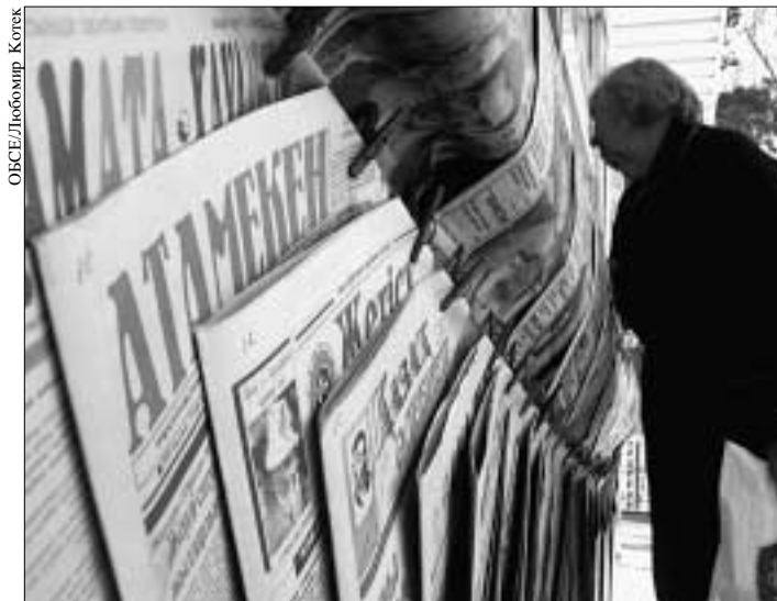
Казахстанские судьи и журналисты расширяют свои познания в вопросе о диффамации

28 февраля – 2 марта в Маврово, в окрестностях Скопье, состоялось