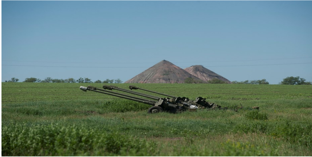
Артилерійські гармати на сході України