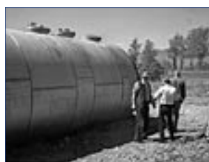
Офис ОБСЕ в Ереване помог завершить исследование об экологически безопасной переработке 872 тонн меланжа (компонента ракетного топлива).

Основные индустриальные «горячие точки», близкие к городским поселениям представляют серьезные угрозы для здоровья. Деградация земель из-за чрезмерного использования пестицидов и удобрений, радиоактивные или химические отбросы ведут к утрате средств существования и миграции. Прямое наследие предыдущих конфликтов, такое как противопехотные мины и не взорванные боеприпасы ведут к смерти, ранениям и лишению земель. Все эти вопросы стоят в ряду тех проблем, с которыми сталкиваются БКДЭОС и региональные миссии ОБСЕ на местах.