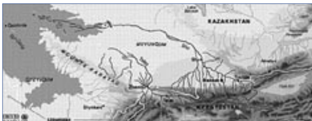
Карта рек Чу и Талас

В этих условиях БКДЭОС разработал проект под названием «Создание двусторонней казахско-кыргызской комиссии по межгосударственному использованию водных сооружений на реках Чу и Талас», реализуемый Центром ОБСЕ в Алматы в тесном сотрудничестве с Министерством сельского хозяйства Республики Казахстан, Министерством сельского и водного хозяйства и перерабатывающей промышленности Кыргызской республики, а также агентствами ООН ЕЭК ООН,