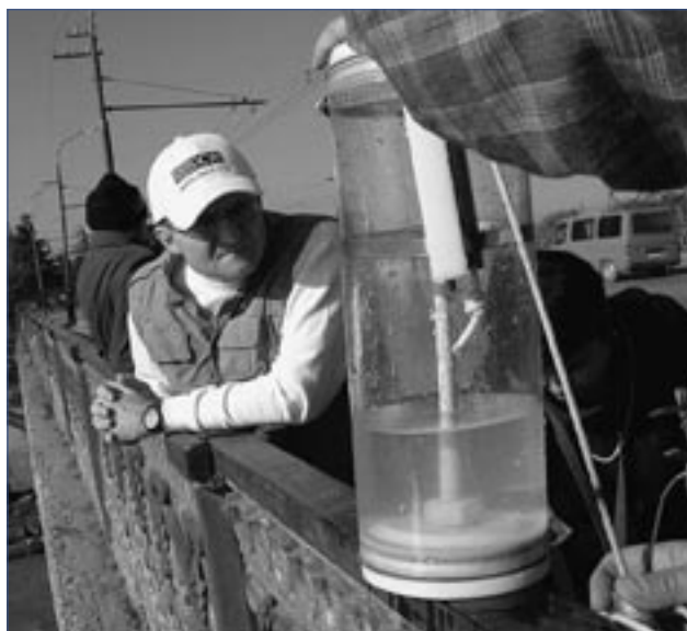
ОБСЕ поддерживает процесс мониторинга на реке Кура. На снимке: образцы берутся из реки Кура в Рустави, Грузия. Ученые используют оборудование для анализа образцов, составляющих исходные экологические данные.

Центр ОБСЕ в Алматы надеется, что положительный опыт в сотрудничестве на реках Чу и Талас, приобретенный во время реализации проекта, станет моделью для налаживания сотрудничества на дру-