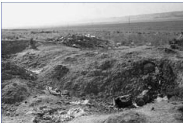
Двадцать тысяч тонн сельскохозяйственных пестицидов и других токсичных отходов захоронены в районе села Эгизбулок Джизаской области Узбекистана. Многие из этих складов получили выход наружу, подвергая местные села реальной угрозе.

Офис сотрудничал с «Ассоциацией молодых юристов и экономистов, специализирующихся на вопросах экологии» в организации круглых столов в регионах Армении на тему «Закон о целевом использовании сборов с организаций на охрану природы». Результаты данных усилий проявились в решении пяти муниципалитетов из разных районов подать дебютные заявки на получение средств для реали-