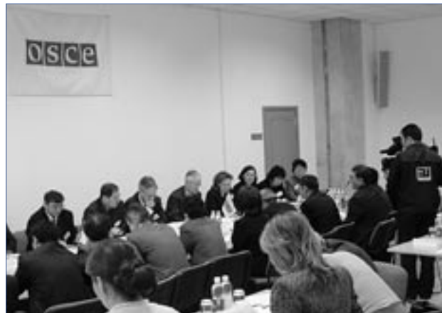
Обучение для судей районных судов

Четыре двухдневных семинара – по два для каждой целевой группы, состоящих из судей и прокуроров – были проведены в октябре-ноябре 2004 г. Темы семинаров включали: «Внедрение международных экологических конвенций в Казахстане, включая Орхусскую конвенцию и другие правовые акты, ратифицированные Казахстаном»; «Вопросы поддержки антимонополии и справедливой конкуренции, включая ознакомление с законом о конкуренции Европейского Союза» и «Законодательные рамки для защиты экономической конкуренции в Казахстане».