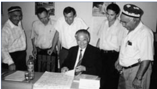
ОБСЕ совместно с Фондом махаллей провели серию семинаров для руководителей махалли (местные общины самоуправления) в различных областях Узбекистана.

Офис ОБСЕ в Баку продолжает поддерживать деятельность Орхусского общественного экологического информационного центра совместно с Министерством экологии и природных ресурсов. Орхус-центр предоставляет свободный и открытый доступ для