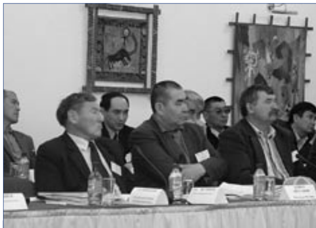
Фермеры на семинаре по внедрения Земельного кодекса

Новый Земельный кодекс, принятый в 2003 г., утвердил частное владение на землю и новые условия фермерства в Казахстане. С тех пор, ключевой задачей для страны стало гарантирование его эффективного внедрения. Особенно важными явились временные положения, юридическая сила которых утратила силу в конце 2004 г.