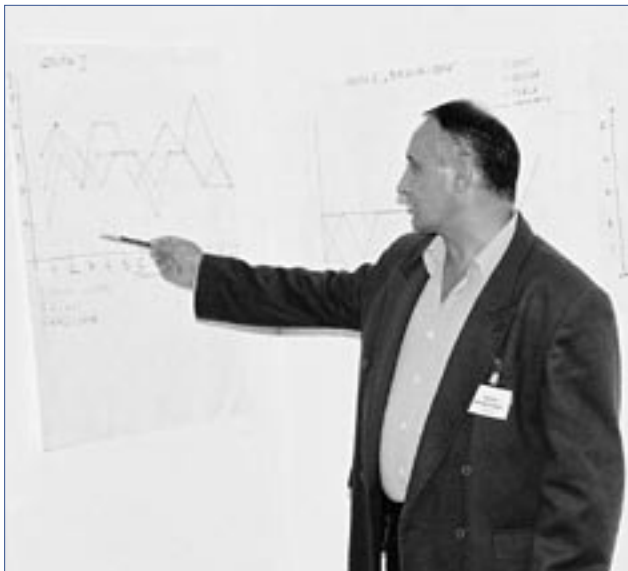
Встреча группы местных вовлеченных сторон по вопросам бассейна реки Савы

ОБСЕ продолжила деятельность по поддержке Рамочного соглашения по реке Сава, вступившего в силу 29 декабря 2004 г., посредством оказания содействия Постоянному Секретариату Международ-