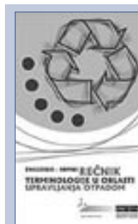
Словарь терминов по утилизации отходов

В качестве составляющей в работе над приведением законодательства Сербии и Черногории в соответствие с европейскими стандартами, Миссия опубликовала Словарь по организации сбора и утилизации отходов, который служит в качестве дополнения к опубликованному ранее экологическому слова-