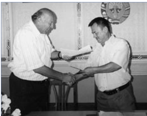
Представители приграничных насосных станций подписывают соглашение о разделе воды, направленное на разрешение давнего напряжения

Одним из таких примеров является Араванский район Ошской области, где кыргызская общинная организация, совместно с местными властями организовала серию обучающих мероприятий, посвященную справедливому распределению воды и улучшенным приграничным отношениям. Участниками мероприятия стали техники по воде, представители местной власти, фермеры, женщины и молодежь. Темы включали местные законы о воде и анализ решения проблем. Также были проведены заседания, которые изучили перспективы каждой общины. Совместные мероприятия, такие как викторины и игры, способствовали дальнейшему укреплению отношений.