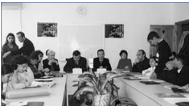
Орхус-центр в Баку проводит общественную встречу.

всех членов общества к экологической библиотеке, интернету, конференц-залу для проведения экологических мероприятий. В течение 2004 г. более 200 посетителей в месяц пользовались услугами библиотеки и Интернет кафе, более 60 общественных совещаний было проведено в конференц-зале по широкому спектру экологических вопросов. Офис также профинансировал несколько собственных проектов в Орхус-центре, включая общественные слушания по таким законопроектам как «Охрана биоразнообразия», и программы экологического образования для детей.