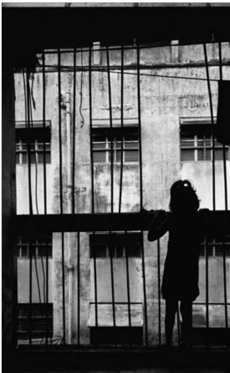
Экономические лишения и нехватка социальной сплоченности подпитывают незаконную торговлю