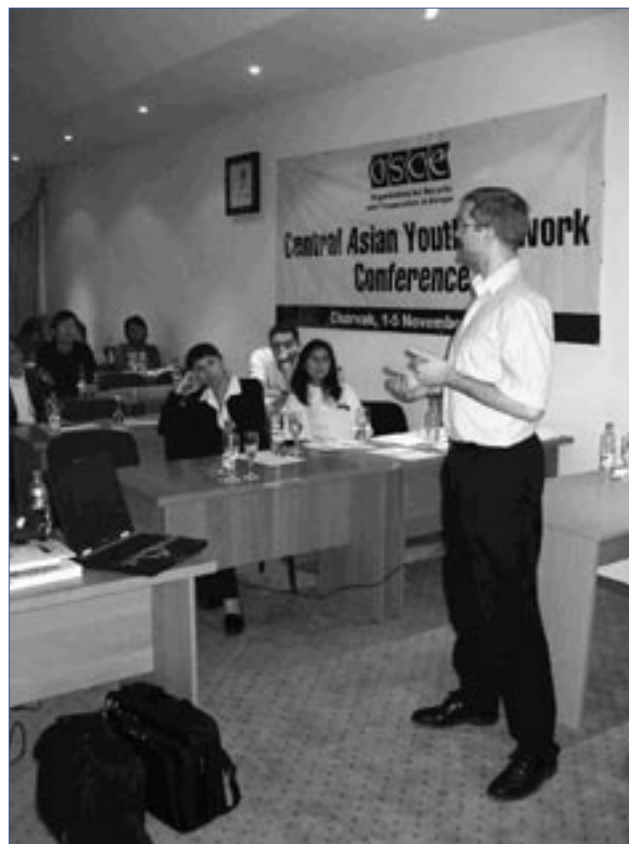
Пятьдесят четыре студента из Центральной Азии приняли участие в 2004 г. и 2005 г. в проекте под названием Центральноазиатская молодежная сеть

ности поддержать проект. Цель проекта – усовершенствовать институционально-кадровый потенциал ведущих университетов Центральной Азии, который в будущем позволит проводить качественные исследования в области прикладной экономики и положительно скажется на социально-экономическом развитии региона. В частности, проект направлен на повышение потенциала региональных университетов Центральной Азии с целью проведения прикладных исследований для нужд местного делового сообщества и правительств путем усовершенствования профес-