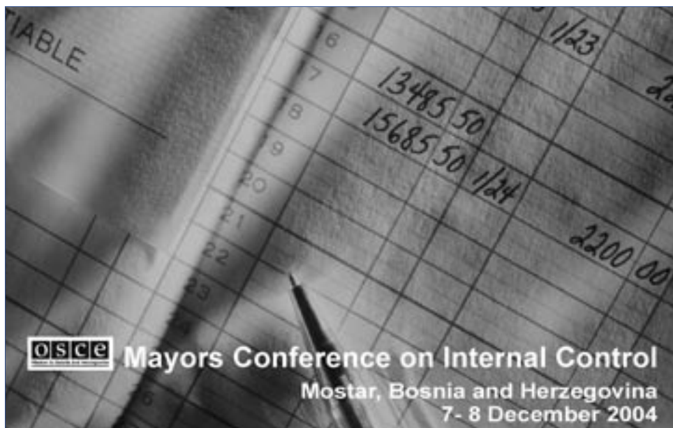
Передовой опыт по внутреннему контролю обсуждался шестидесятью муниципалитетами на конференции в Мостаре

Большинство муниципальных органов Боснии и Герцеговины не имеют формальной функции внутреннего контроля, которая бы позволила выявить ошибки, факты мошенничества, нарушения в снабжении и другие формы злоупотребления государственными