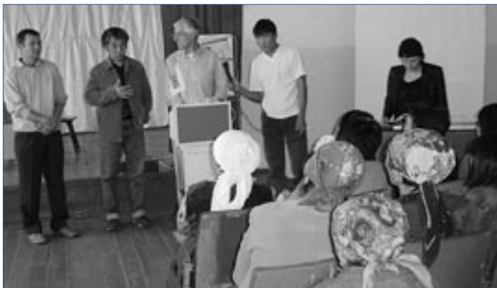
Посол Ивар Викки присутствует на лекции по радиоактивной безопасности, проводимой в поселке Саржал

вание «горячих точек» и повышение осведомленности о радиационно-экологической ситуации в Сугхде».