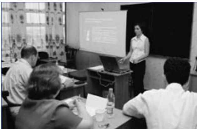
Обучение принципам прикладного экономического исследования в Международной бизнес-школе «Келаджак Илми» в Ташкенте.

циальную обучающую программу для сотрудников Агентства, которая охватит различные темы, включая привлечение инвестиций, обслуживание инвесторов и последующие услуги инвесторам.