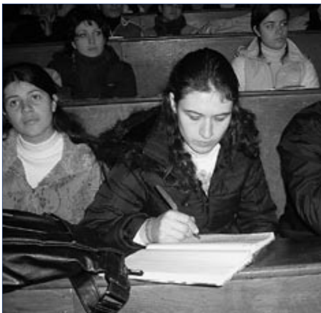
Студенты Университета Гирокастры им. Экрема Цабея, заинтересованные в деловой этике как части будущей учебной программы, присутствуют на лекции

Организаторы провели десять встреч между студентами и представителями коммерческих компаний на протяжении двух дней в пяти университетах страны. Участники расценили тему как весьма важную и поддержали идею ее включения в учебную программу по экономике. Студенты и потенциальные преподаватели данного предмета в университетах Элбасани и Шкодры выразили рабочей группе, подготовившей книгу, признательность за усилия, назвав ее важным инструментом в деле подготовки соответствующей учебной дисциплины в предстоящем учебном году.