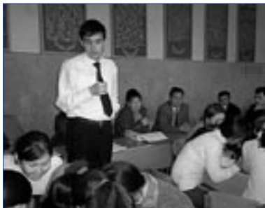
На одном из занятий, организованных для молодых туркменских женщин

екта, спонсируемого ОБСЕ, «Центр социального партнерства» провел обучающие тренинги, для местных учителей и представителей местных властей с целью оказания помощи в предоставлении консультаций по вопросам трудоу-