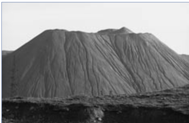
Над городом Табошар (Таджикистан) возвышается 300 метровый холм из радиоактивных отходов. Отходы разносятся ветрами и размываются дождями, представляя угрозу окружающей среде и здоровью человека.

Вслед за рекомендациями Экономического форума БКДЭОС разработал серию мероприятий в речных