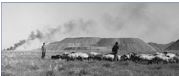
Открытая и незащищенная свалка радиоактивных отходов рядом с селом Койташ, Джизакская область, Узбекистан

Национальный отчет о выполнении Орхусской конвенции в Кыргызской республике, подготовленный МЭЧС, был представлен и обсужден правительством, представителями правовых структур и неправительственных экологических НПО и СМИ на последнем семинаре в январе 2005 г. Участники семинара приняли резолюцию, одобряющую Отчет, представленный на Второй встрече сторон Орхусской конвенции 25–27 мая 2005 г. в г. Алматы, Казахстан.