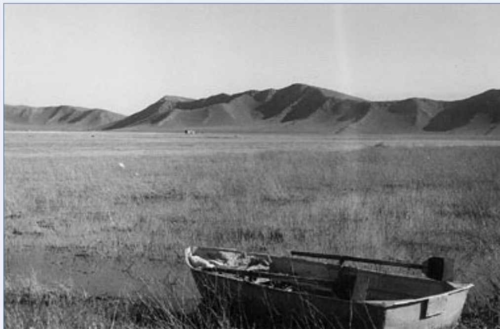
Затопленные земли вокруг озера Арнасай в провинции Джиззах, 18 марта 2004 г. Уровень подземных вод поднялся из-за плохого хозяйствования в зимний период в водном и энергосекторах прибрежных государств Казахстана, Кыргызстана и Узбекистана

жение «Биом» организовали серию региональных семинаров, стимулирующие правительственные и неправительственные экологические органы к изучению Орхусской конвенции для работы над специальными экологическими вопросами как внутри страны, так и на региональном уровне, и обмениваться информацией о положительном опыте.