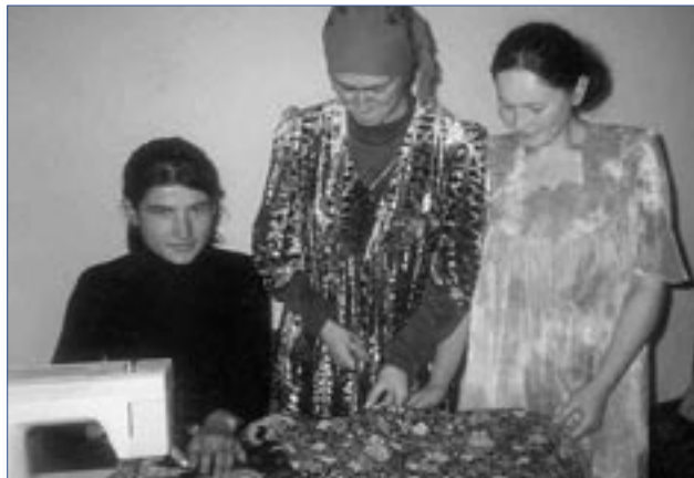
Небольшая группа женщин в Хороге, столице Горно-Бадахшанской автономной области, открыла курсы шитья с помощью микрокредита, который группа получила благодаря проекту по обучению бизнесу и микрокредитованию НПО «Магина».

Данный уровень программы YES, включивший в себя презентацию о деятельности Центра по защите жертв торговли людьми и другим вопросам относящимся к теме незаконной торговли, был реализован в сотрудничестве с отделом демократизации. Координационные центры ОБСЕ по гендерному равенству, располагающие офисами во всех трех округах, выступили в качестве исполнительных партнеров на региональном уровне.