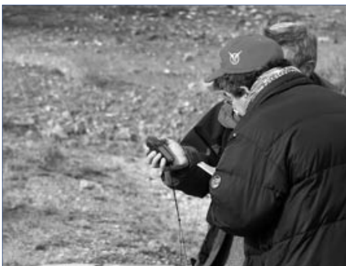
Измерение радиоактивности в Ферганской долине

Проектная деятельность охватила территорию 28