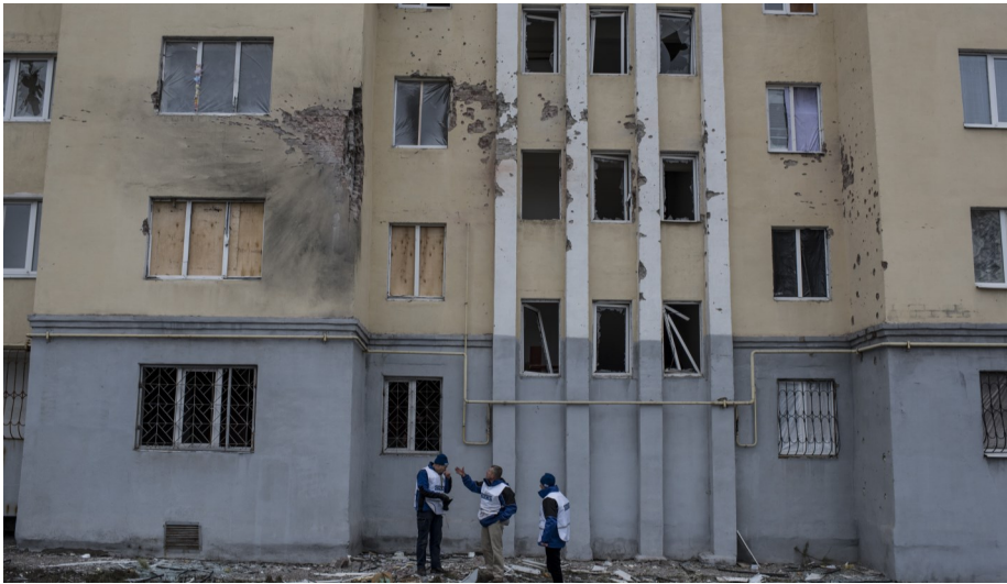
Спостерігачі СММ оцінюють наслідки обстрілу в Маріуполі, січень 2015.