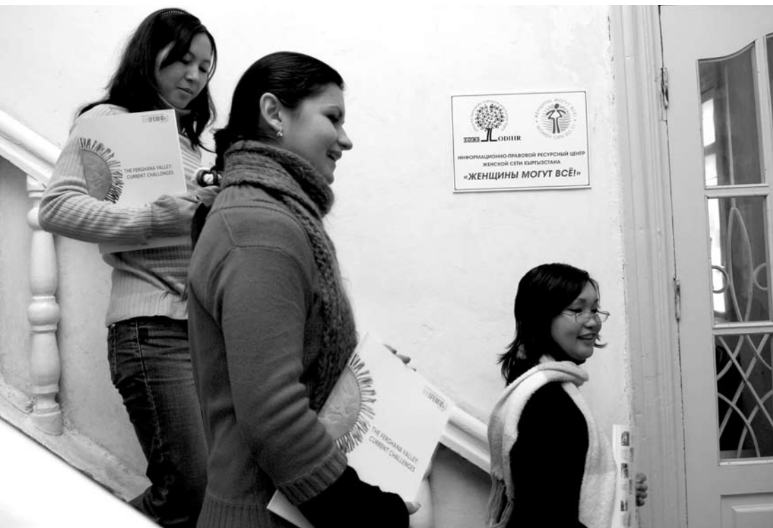
Представители региональных сетей Азербайджана и Кыргызстана на семинаре по вопросам выдвижения женщин на руководящие должности, состоявшемся в апреле в Бишкеке.

необходимого опыта, возможностей или политической воли для предотвращения бытового насилия и судебного преследования виновных. Эта ситуация особенно распространена там, где бытовое насилие по традиции считается частным делом и отсутствуют какие-либо юридические меры для преследования виновных и защиты их жертв. Со времени принятия в 2004 году новой редакции Плана действий ОБСЕ по гендерным вопросам БДИПЧ активизировало свою деятельность в области предотвращения бытового насилия и борьбы с ним. Особое внимание обращается на повышение осведомленности и потенциала государственных структур и организаций гражданского общества в плане эффективной профилактики бытового насилия, судебного преследования виновных и учета потребностей потерпевших.