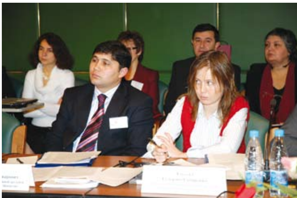
Участники московской конференции по новому иммиграционному законодательству Российской Федерации.

получить как принимающие страны, так и страны происхождения, и тем, и другим необходимо приложить удвоенные усилия.