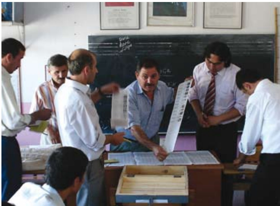
Сотрудники избирательного участка ведут подсчет голосов во время парламентских выборов в Турции 22 июля.

выборов» будут учтены соответствующие международные события, в том числе связанные с применением принципа прецедентного права Европейским судом по правам человека. Этот документ более подробно остановится на таких темах, как выделение избирательных округов и равное избирательное право, национальные меньшинства, гендерные проблемы, голосование внутренне перемещенных лиц и защита избирательных прав. В него также войдут рекомендации по анализу законов, связанных с применением новых технологий голосования.