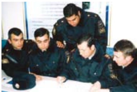
Офицеры полиции Азербайджана обсуждают проблемы бытового насилия во время учебных курсов, организованных в полицейской академии в Баку.

Например, в Армении БДИПЧ оказало экспертную и финансовую помощь Ассоциации армянских женщин с высшим образованием для проведения целой серии учебных семинаров по политическим и гражданским правам, участию в общественной жизни, развитию политических партий и проблемам выборов, слушателями которых стали женщины-члены политических партий и активистских организаций