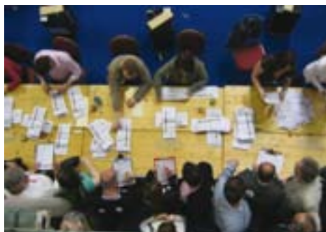
Подсчет голосов на парламентских выборах в Ирландии 24 мая.

» Соответствие стандартам по проведению демократических выборов. Государства-участники ОБСЕ обязались проводить выборы в соответствии с критериями Копенгагенского документа 1990 года, которые и лежат в основе проводимой БДИПЧ оценки любых выборов. Многие государства-участники