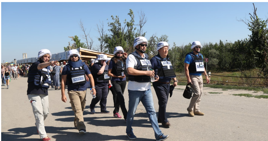
Голова СММ ОБСЄ з іншими спостерігачами СММ на контрольному пункті в'їзду-виїзду в Станиці Луганській, Луганська область, 29 серпня 2016 року.