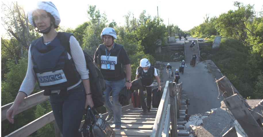
Наблюдатели СММ ОБСЕ на мосту в Станице Луганской, Луганская область, май 2016 г.