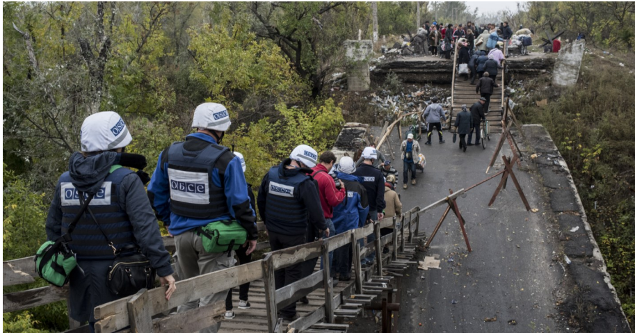
Спостерігачі СММ ОБСЄ здійснюють патрулювання в районі Станиці Луганської, Луганська область, вересень 2016 року.