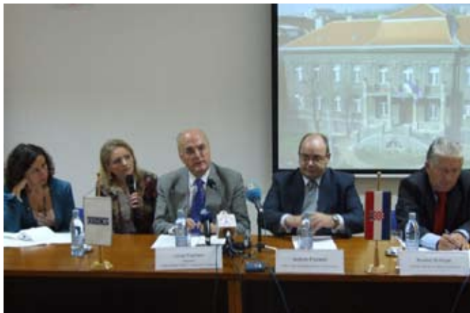
Voditelj Misije OEES-a u RH, veleposlanik Jorge Fuentes, državni tajnik, Antun Palarić i ravnatelj Akademije, Branko Bošnjak, na tiskovnoj konferenciji o predstavljanju Akademije lokalne demokracije, 27. listopada 2006.