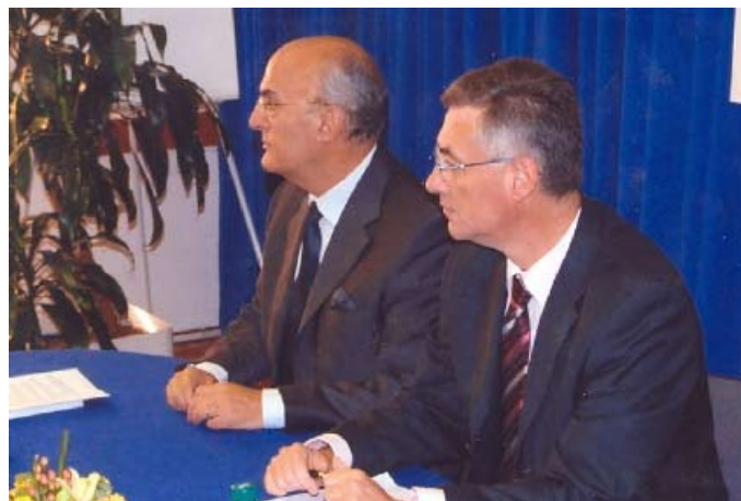
Predsjednik Vrhovnog suda Branko Hrvatinić govori o zaostacima u pravosuđu u Glavnom uredu Misije 4. listopada 2006. godine.

Gomilanje predmeta, koje se obično označava kao „zaostaci“, vjerojatno je jedan od najznakovitijih problema hrvatskog pravosuđa.