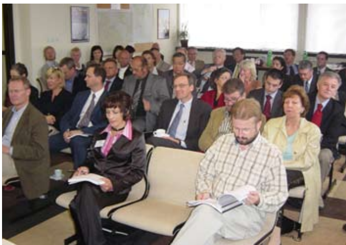
Gotovo 40 veleposlanika i predstavnika veleposlanstava država članica OEES-a prigodom posjeta Područnom uredu Sisak, 5. listopada 2006.