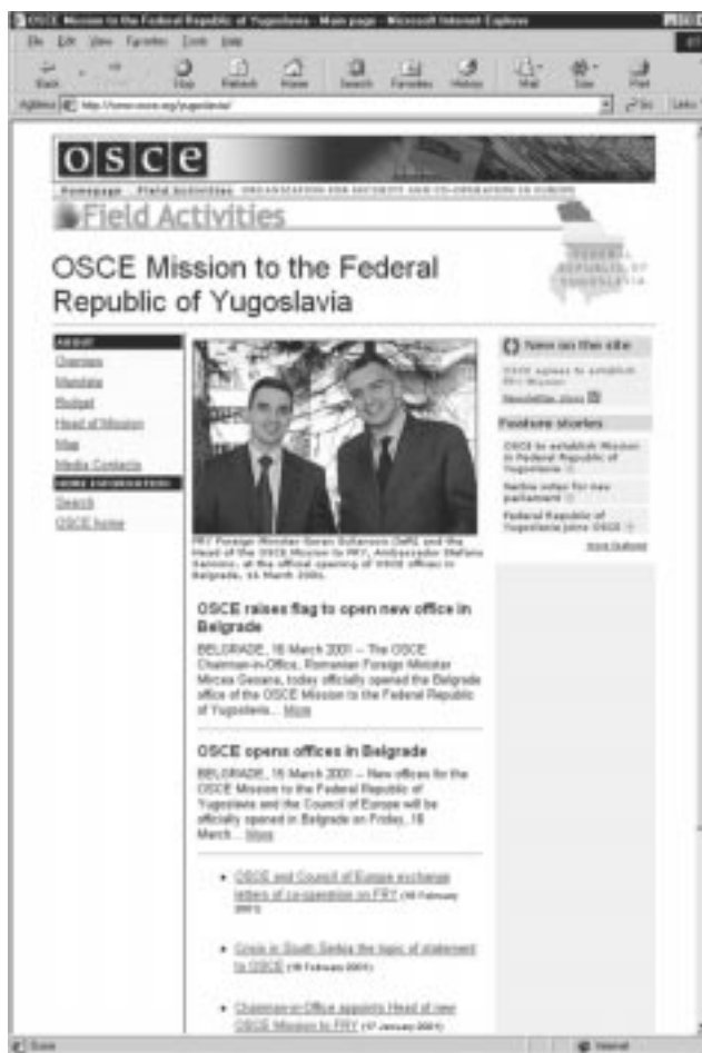
Веб-сайт ОБСЕ после обновления: страница новой Миссии в Союзной Республике Югославии.

По приглашению, исходившему от Швеции как председателя ЕС, а также от посла Бьюрнера, возглавляющего комитет по политическим вопросам и вопросам безопасности, Генеральный секретарь посетил 27 февраля Брюссель, где имел, кроме того, встречи в Европейской комиссии, главном управлении внешних связей и секретариате Совета. Я. Кубиш беседовал с заместителем начальника главного управления Валенсуэлой,