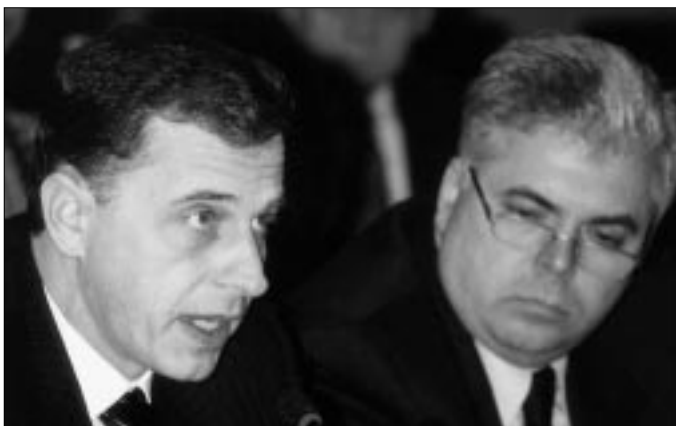
Министр иностранных дел Румынии, ДП ОБСЕ Мирча Дан Геоана (слева) выступает на заседании Постоянного комитета. Рядом – Председатель ПА ОБСЕ Адриан Северин.

Данная рекомендация была представлена на рассмотрение Постоянного комитета, который после серьезной дискуссии пришел к выводу, что содержащиеся в ней формулировки не пользуются единодушной поддержкой делегатов. Поэтому место делегации Беларуси в Ассамблее пока останется незанятым.