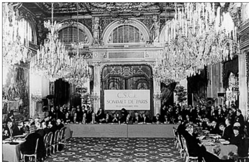
Первоначальное решение о создании Центра по предотвращению конфликтов было принято в 1990 году на Парижской встрече на высшем уровне, когда Организация еще называлась СБСЕ

Был открыт ситуационный центр, благодаря чему ЦПК получил возможность круглосуточно вести опе-