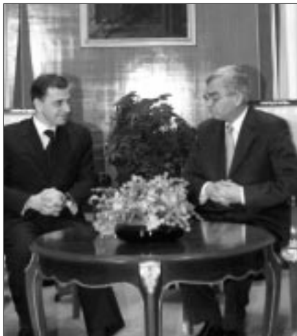
Действующий председатель ОБСЕ Мирча Геоана (слева) в ходе своего визита в Тирану встречается с президентом Албании Реджепом Мейдани

роны как Миссии ОБСЕ в Боснии и Герцеговине, так и Управления Высокого представителя. «Высокий представитель и Миссия ОБСЕ в Боснии и Герцеговине проявляли терпение, пока конституционный суд рассматривал жалобу ХДП на ОБСЕ. Однако 2 февраля суд постановил отвергнуть апелляцию ХДП», – отметил М. Геоана. Статутами кантонов и конституцией Федерации Боснии и Герцеговины установлены четкие сроки для проведения инаугурационных сессий данных органов, и эти сроки давно уже прошли, добавил он.