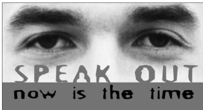
Проект ОБСЕ «телефонная линия помощи свободным СМИ» имеет броский логотип

Данное руководство, официальная презентация которого состоялась в мае 2000 года, информирует полицейских о правах журналистов и о том, как с ними надлежит обращаться, и в то же время доводит до сведения журналистов их обязанности в отношении полиции. Принципы, изложенные в данном руководстве, соответствуют внутреннему законодательству и международным нормам, касающимся прав человека.