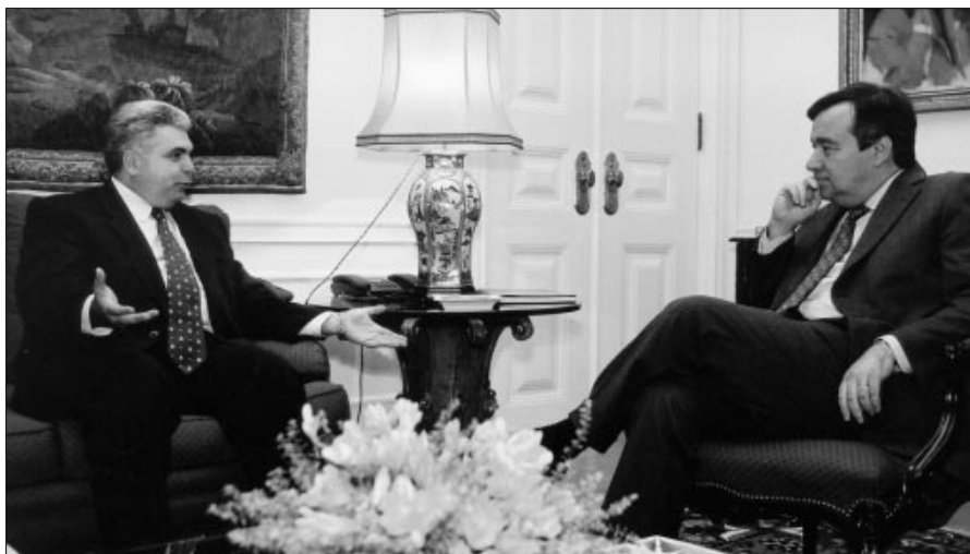
Председатель Парламентской ассамблеи ОБСЕ Адриан Северин (слева) беседует с премьер-министром Португалии Антониу Гутерришем.