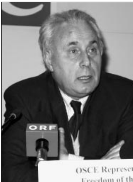
Представитель ОБСЕ по вопросам свободы СМИ Фраймут Дуве