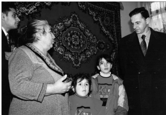
ДП в Баку (Азербайджан) во время посещения общежития для лиц, ставших вынужденными переселенцами в результате нагорнокарабахского конфликта

нужденных переселенцев, предложив от имени ОБСЕ помощь и услуги экспертов в поиске долговременного решения этой многогранной проблемы.