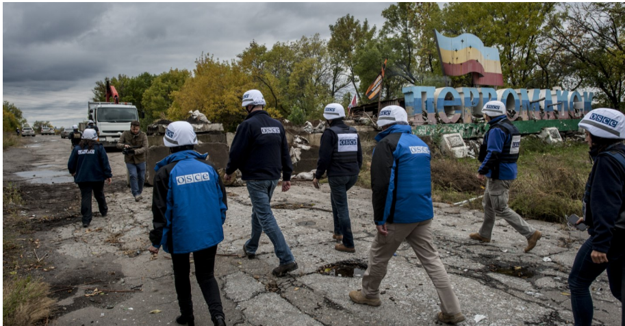
Наблюдатели СММ ОБСЕ совершают патрулирование в районе Золотого-Первомайска, Луганская область, 26 сентября 2016 года.