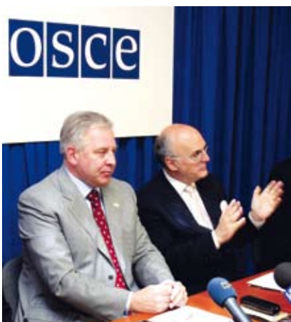
Voditelj Misije prvi put se susreo s premijerom Ivom Sanaderom u svibnju 2005. godine, a premijer je uzvatio posjet nekoliko tjedana kasnije, posjetivši glavni ured Misije.

T ijekom gotovo tri godine otkako sam došao na čelo Misije OESS-a u RH - koja je od 1. siječnja 2008. godine postala Uredom - imao sam čast sastati se premijerom Sanaderom u brojnim prigodama. Ovdje neću uključiti neformalne ručkove, službene večere, kontakte na marginama sastanaka na vrhu ili premijerovo sudjelovanje na konferencijama ili okruglim stolovima organiziranim od strane Misije ili posjet mojoj izložbi slika „Čovjek i grad“.