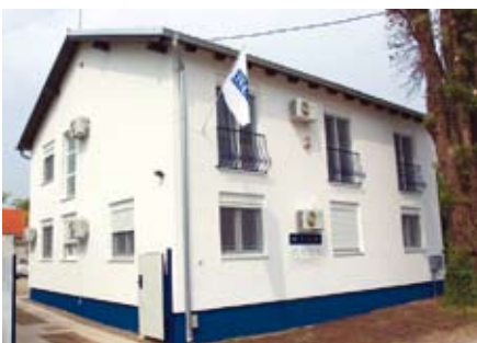
Zgrada Područnog ureda Misije OEES-a u Vukovru

Gotovo svi područni uredi bili su smješteni u malim gradovima na ratom pogođenim područjima u unutrašnjosti Hrvatske, takozvanim 'područjima posebne državne skrbi'. U nekim mjestima još se osjećala velika malodušnost prouzročena ratom, no sva su bila dopadljiva i slikovita: privlačna mjesta za obavljanje svakodnevnih djelatnosti dužnosnika OEES-a. Na koncu, osoblje dvaju područnih ureda imalo je sreću biti smješteno na obali! Naime, potreba za održavanjem bliskih kontakata između OEES-a i vlasti, sudova i medija u glavnim regionalnim centrima odlučivanja, učinila je nazočnost OEES-a u lijepim turističkim gradovima kao što su Split i Zadar u sunčanoj Dalmaciji apsolutno neophodnom.