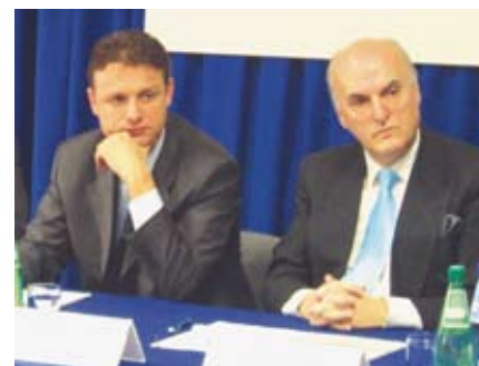
Novi ministar vanjskih poslova i europskih integracija je Gordan Jandroković, kojega vidimo na slici tijekom njegova posjeta Glavnom uredu OESS-a u Zagrebu u 2007.

Državni tajnik za upravu, Antun Palarić, najavio je kako će novi Zakon o državnim službenicima očistiti državnu upravu od ljudi koji nemaju besprijekorni osobni i radni profil. Novi zakon predviđa mogućnost suspendiranja svakoga tko je osumnjičen za korupciju. Prema novom Zakonu, „zviždači“, oni koji prijave korupciju, bit će zaštićeni od negativnih posljedica svog čina na svojim radnim mjestima.