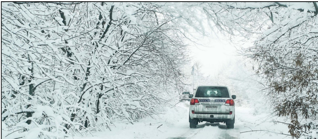
СММ ОБСЄ під час патрулювання біля Дебальцевого, 25 листопада 2017 року.