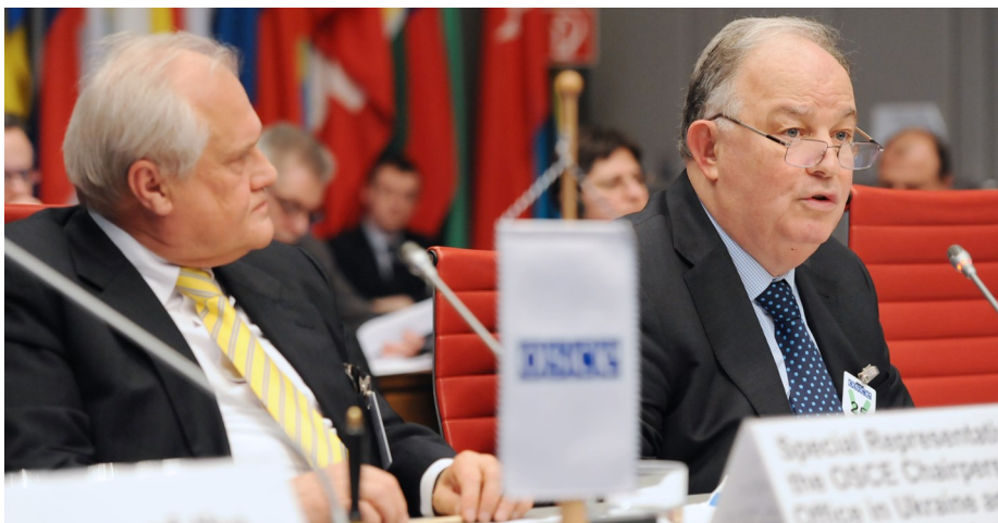
Голова Спеціальної моніторингової місії ОБСЄ в Україні Ертурул Апакан виступає на засіданні Постійної Ради ОБСЄ, Відень, 28 січня 2016 року.