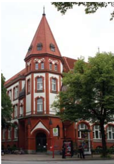
Центр по исследованию проблематики ОБСЕ (КОРЕ) является частью Института исследований проблем мира и политики безопасности Гамбургского университета