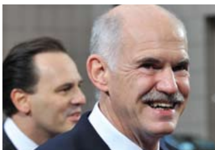
ФОТО АЛПЖОЖ ТУБЕ