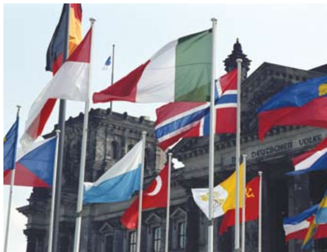
19 июня 1991 года, Берлин. Открытие первой встречи глав МИД государств – участников СБСЕ в Рейхстаге