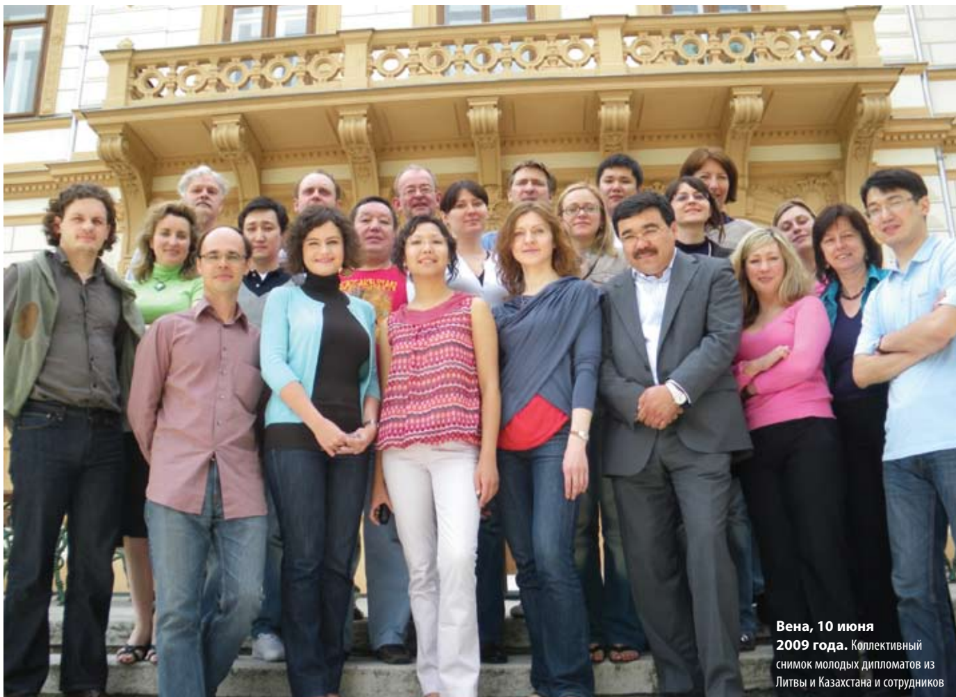
Вена, 10 июня 2009 года. Коллективный снимок молодых дипломатов из Литвы и Казахстана и сотрудников