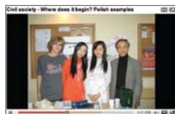
«С чего начинается гражданское общество?»