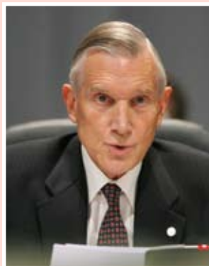
БЕЛА ВЕНЖА ДОПЛЯНЬ

Яп де Хооп Схеффер, Действующий председатель ОБСЕ (1 января – 3 декабря 2003 года). Министр иностранных дел (2002–2003 год). Генеральный секретарь НАТО (2004–2009 годы). С сентября 2009 года заведующий кафедрой по вопросам мира, правопорядка и безопасности Лейденского университета.