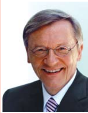
СЕКРЕТАРИАТ АВСТРИЙСКОЙ НАРОДНОЙ ПАРТИИ

Кнут Воллебек, Действующий председатель ОБСЕ. Министр иностранных дел (1997–2000 годы). Председатель Группы видных деятелей по вопросам повышения эффективности ОБСЕ (2005 год). Посол в Соединенных Штатах (2001–2007 годы). С 2007 года Верховный комиссар ОБСЕ по делам национальных меньшинств.