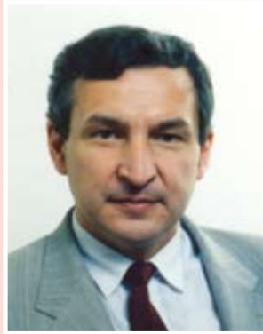
МИД ЧЕШСКОЙ РЕСПУБЛИКИ

Иржи Диншбír, Действующий председатель СБСЕ (1 января – 2 июля 1992 года). Министр иностранных дел и заместитель премьер-министра Чехословакии (1989–1992 годы). Специальный докладчик Комиссии Организации Объединенных Наций по правам человека по положению с правами человека в Боснии и Герцеговине, Республике Хорватии и Федеративной Республике Югославии (1998–2001 годы). С 2008 года член сената Чешской Республики.