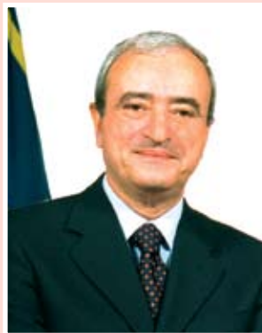
ПРЕСС-СПУЖБА МИНИСТЕРСТВА ОБОРОНЫ ИТАЛИИ

Беньямино Андреатта, Действующий председатель СБСЕ (1 января – 11 мая 1994 года). Министр иностранных дел (1993–1994 годы). Министр обороны (1996–1998 годы). Скончался 26 марта 2007 года.