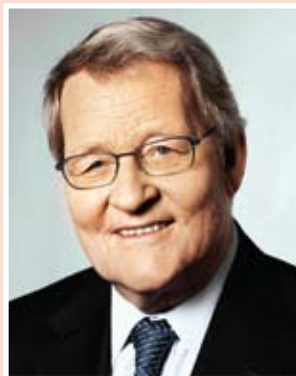
ЦЕНТР ПУБЛИЧНОЙ ДИПЛОМАТИИ МИД ДАНИИ

Флавио Котти, Действующий председатель ОБСЕ. Руководитель федерального департамента иностранных дел (1994–1999 годы). Президент Швейцарской Конфедерации (1991 и 1998 годы).