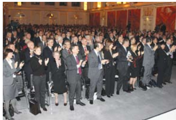
6 ноября 2009 года, Вена. Бурные аплодисменты бывшему министру иностранных дел Гансу-Дитриху Геншеру в Хофбурге

Состоявшееся ранее сегодня в Хофбурге празднование 20-й годовщины падения Берлинской стены наглядно показывает, в чем заключается суть ОБСЕ. Оно напоминает нам о ценности нашего стратегического диалога и усилий по укреплению доверия и расширению сотрудничества в огромном регионе ОБСЕ от Ванкувера до Владивостока посредством осуществления нашей повестки дня, основанной на концепции всеобъемлющей безопасности, и выполнения наших обязательств по защите личных прав и фундаментальных свобод. — Стефан Скялдарсон, посол Исландии в ОБСЕ, от имени делегаций Канады, Исландии, Лихтенштейна, Норвегии и Швейцарии на специальном заседании Постоянного совета 6 ноября 2009 года