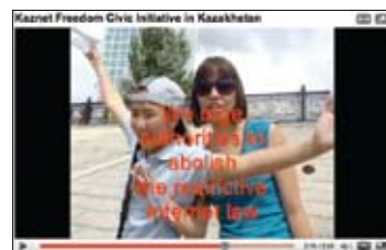
«Свободное плавание в свободном Интернете»