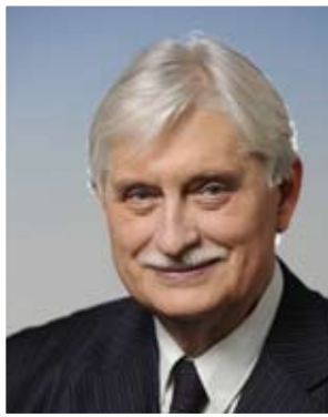
СЕНАТ ЧЕШСКОЙ РЕСПУБЛИКИ