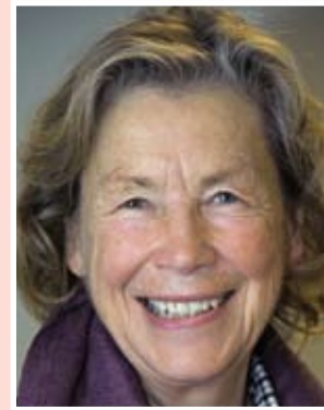
ОСНД ЯРЛА ЯЛМАРСОНА

Йозеф Моравчик, Действующий председатель СБСЕ (3 июля – 31 декабря 1992 года). Последний министр иностранных дел Чехословакии (июль – декабрь 1992 года). Министр иностранных дел вновь провозглашенной Словацкой Республики (март 1993 года – март 1994 года). Премьер-министр Словакии (март – декабрь 1994 года). Мэр Братиславы (1998–2002 годы).