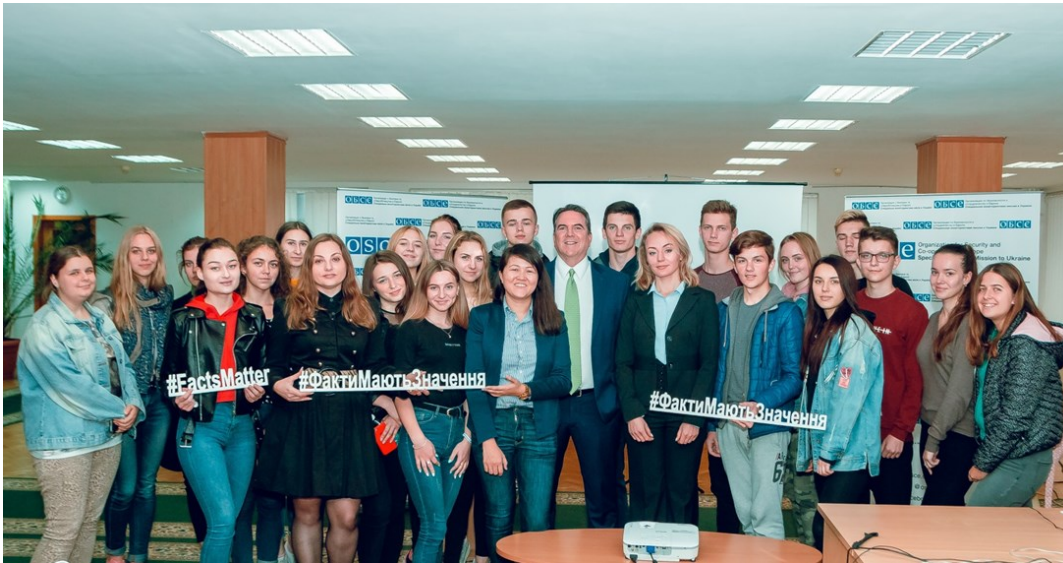
Учасники інформаційного заходу СММ у Східноєвропейському національному університеті ім. Лесі Українки в Луцьку Волинської області