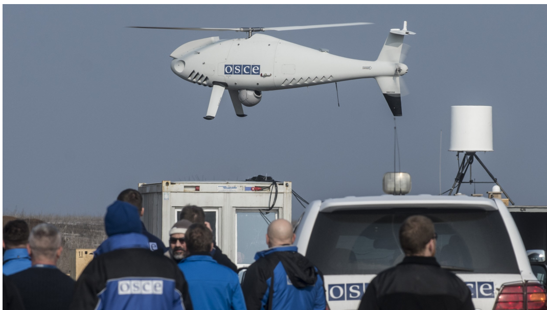
Команда СММ ОБСЕ осуществляет запуск беспилотного летательного аппарата дальнего радиуса действия недалеко от Константиновки в Донецкой области, 28 марта.