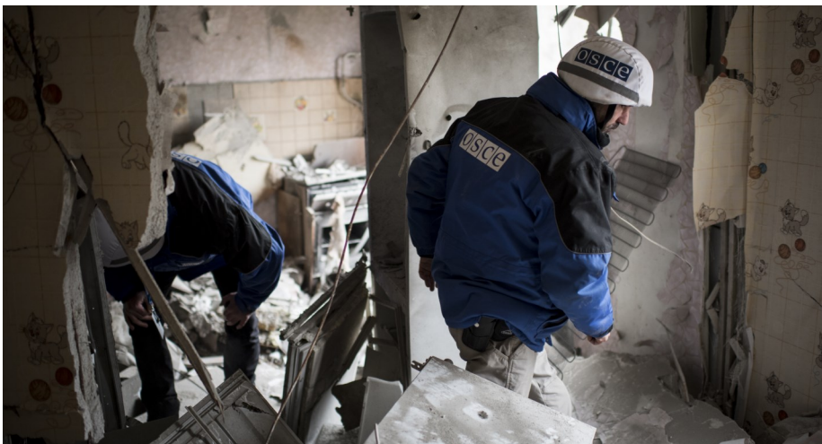
Наблюдатели СММ оценивают повреждения здания на востоке Украины, март 2015 г.