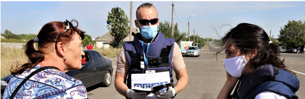
Спостерігачі поблизу Оленівки Донецької області