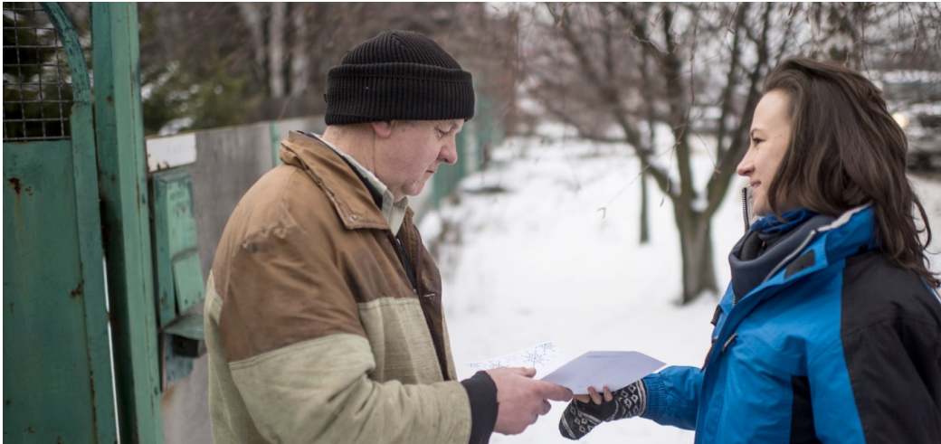
Сотрудница СММ ОБСЕ (справа) общается с жителем Минерального, Донецкая область, 19 февраля 2018 года.