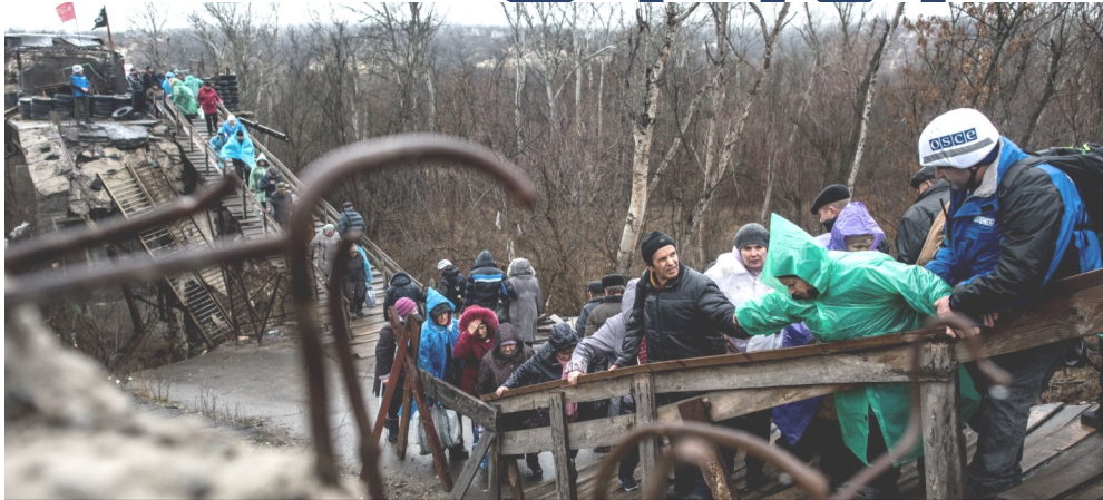
Наблюдатель СММ ОБСЕ помогает людям перейти через мост в Станице Луганской, 21 ноября 2017 года.