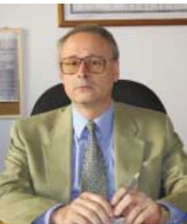
БЮРО ОБСЕ В БАКУ

13 июля карьерный дипломат из Италии Маурицио Павеси вступил в должность руководителя Бюро ОБСЕ в Баку , сменив на этом посту Петера Буркхарда (Швейцария).