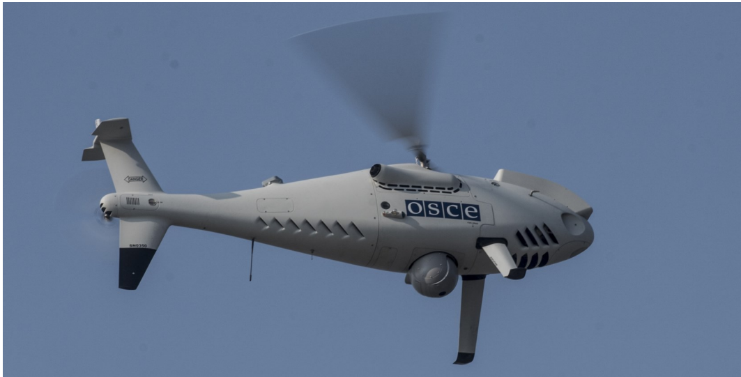
БПЛА СММ дальнього радіуса дії.