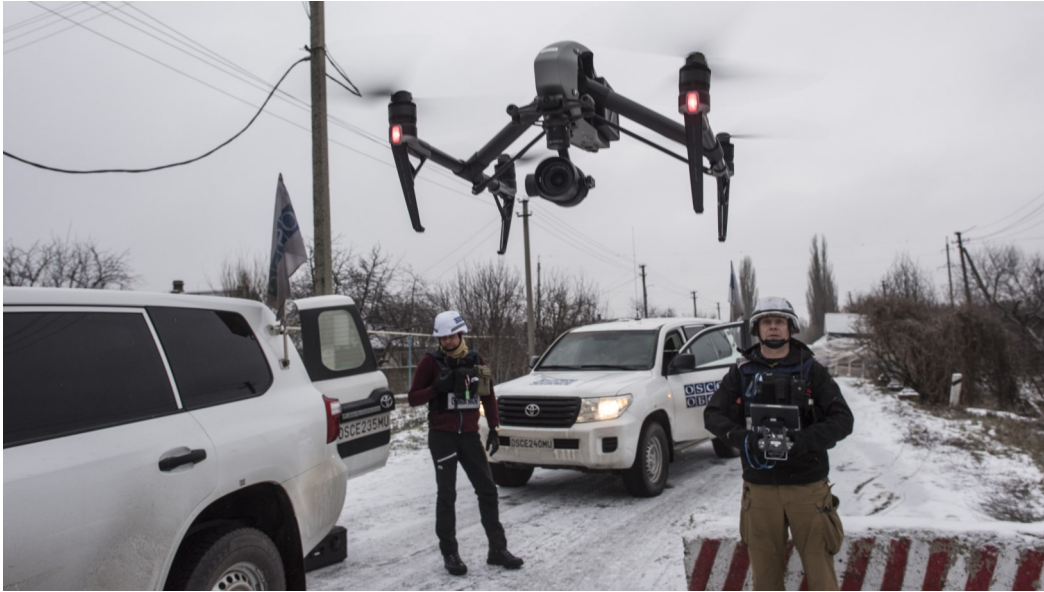
Спостерігачі СММ ОБСЄ запускають безпілотний літальний міні-апарат у непідконтрольному урядові Бетмановому Донецької області, лютий 2018 року.