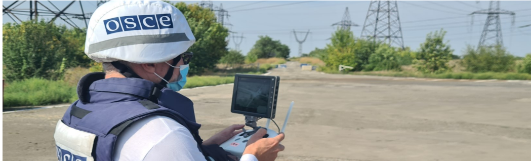
Спостерігач СММ керує польотом БПЛА в Луганській області