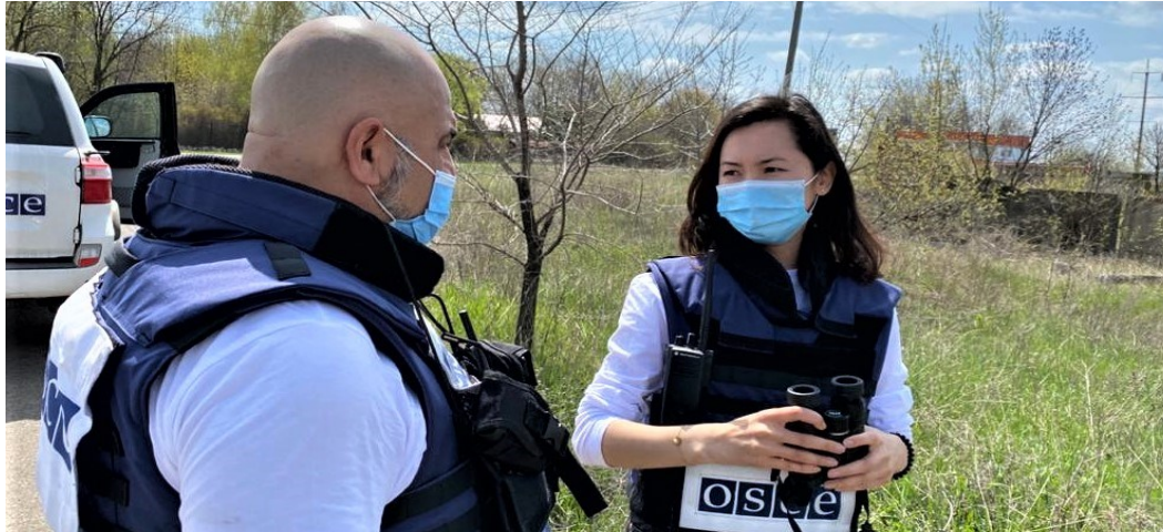
Спостерігачі СММ у Горлівці Донецької області