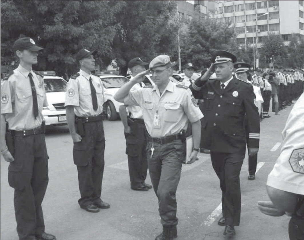
UNMIK Polsinden KPH'ne yetkilerin transferi, devir teslim töreni

KPM'nin araştırmaları, KPH'nin Yıllık raporunda sona erecektir-neticelenecektir. Kamu dokümanı olarak öngörülen yıllık rapor GSÖT, İş İşleri Bakanlığı, Meclis ile Polis Komiserine sunulacaktır. Yıllık rapor, KPH