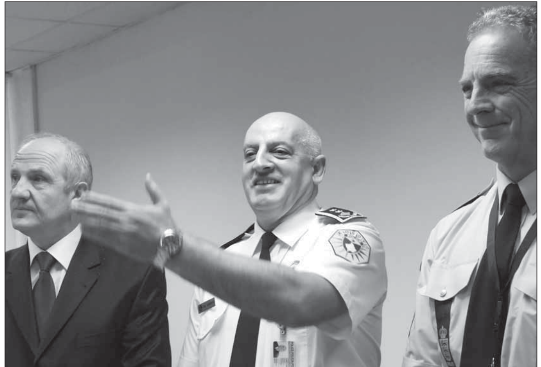
Kosova başkanı Fatmir Seydiu , Albay Şeremet Ahmeti ve Polis Komisyoneri Kai Vittrup ile birlikte

Albay Ahmeti: Bütçemiz Hükümete, yani Kosova konsolide bütçesine bağlı. Bütçe ile şimdiye kadar uluslararası kadro ilgilenirdi, ancak ilerde bu yetkinin yerli personele geçeceğini ve benim administrasyon asistanıma geçeceğini tahim ediyorum. Hükümet ve Bakanlık ortak bir işbirliği sürdürerek bütçe ile bizim ilgilenmemizin doğru olacağını düşünüyorum.