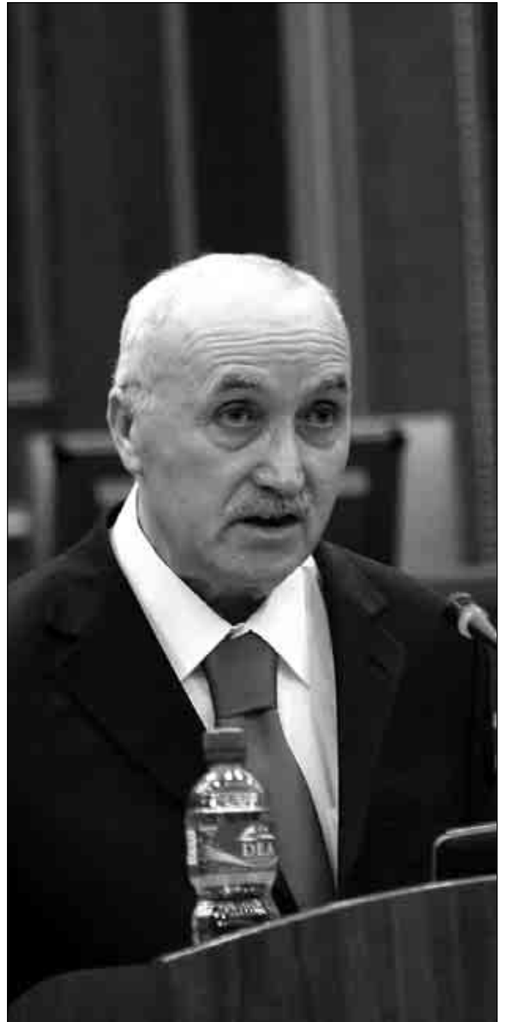
Kryetari i Kuvendit Kolë Berisha

Duke qenë njeriu i parë ndër të barabartët në këtë shtëpi, krahas përpjekjeve të pandërprera për krijimin e kushteve më të mira për punë normale dhe për zgjidhjen e problemeve eventual të secilit deputet veç e veç, dhe të gjithëve së bashku (natyrisht,