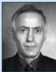
Jakup Krasniqi PDK