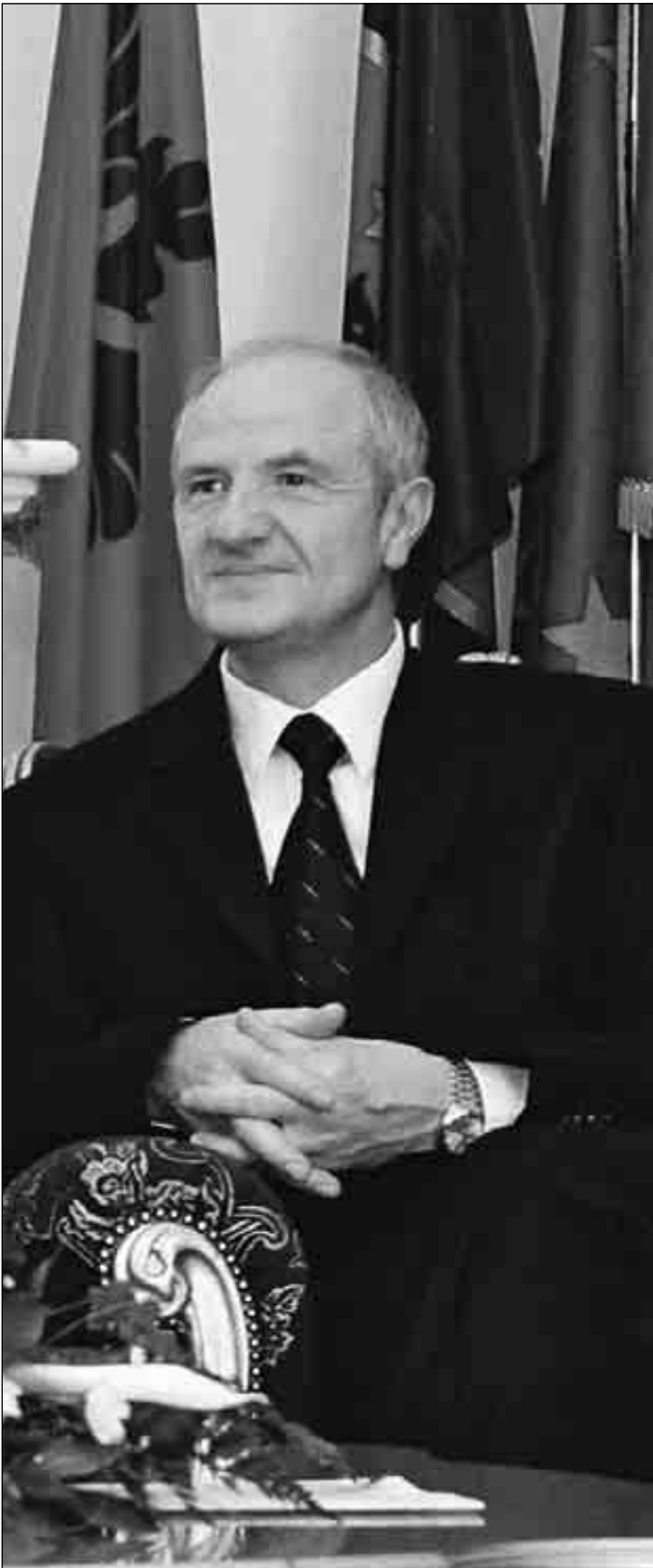
Presidenti Fatmir Sejdiu