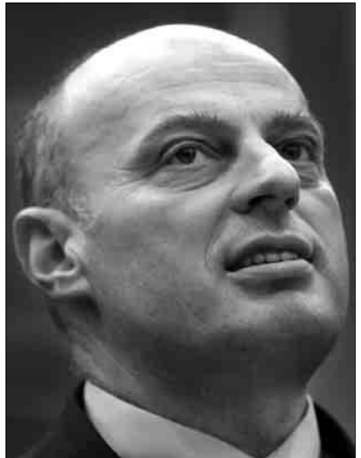
Kryeministri Agim Çeku

Qytetari i Kosovës do të jetë në qendër të punës dhe të veprimeve tona. Ne si qeveri do të jemi të hapur ndaj të gjitha detyrimeve, duke u ballafaquar me sfidat e qeve-