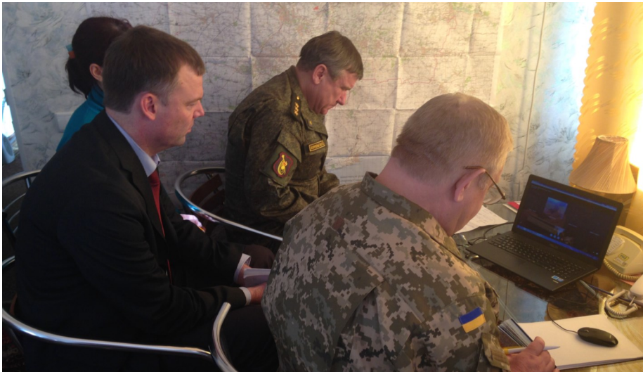
Заступник Голови СММ провів переговори в Соledарі, присвячені доступу СММ до Дебальцевого, 17 лютого 2015 р.