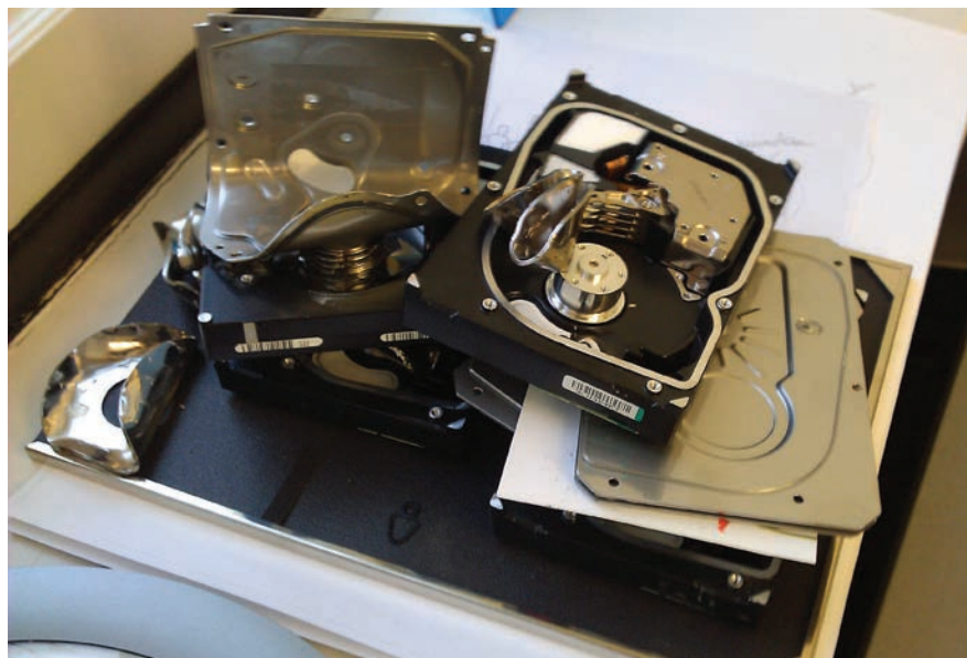
Uništeni hard driveri koji su prethodno sadržavali šifrirane glasove u Estoniji, 2011. godine