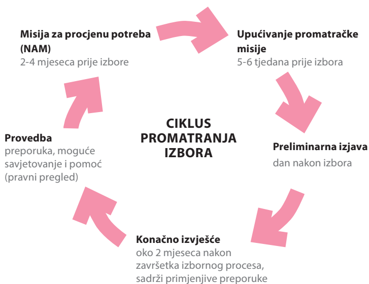
Dijagram 1: Ciklus promatranja izbora

Sukladno ODIHR-ovom Priručniku za promatranje izbora, promatranje izbora nije samo sebi cilj, već mu je namjera pomoći državama sudionicama OESS-a u provedbi njihovih opredjeljenja vezanih za izbore. Najveća korist od promatranja izbora može se postići samo ako su preporuke koje daje u potpunosti i ozbiljno uzete u razmatranje i učinkovito provedene. Učinkovit proces provedbe preporuka može poboljšati utjecaj i korist od aktivnosti promatranja izbora. To je sastavni dio izbornoga ciklusa i treba ga početi čim se objavi završno izvješće s preporukama.