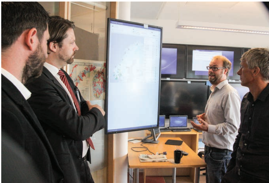
Promatrači raspravljaju s izbornim službenicima u Norveškoj o procesima glasovanja putem interneta i kako se oni prate, 2013. godine