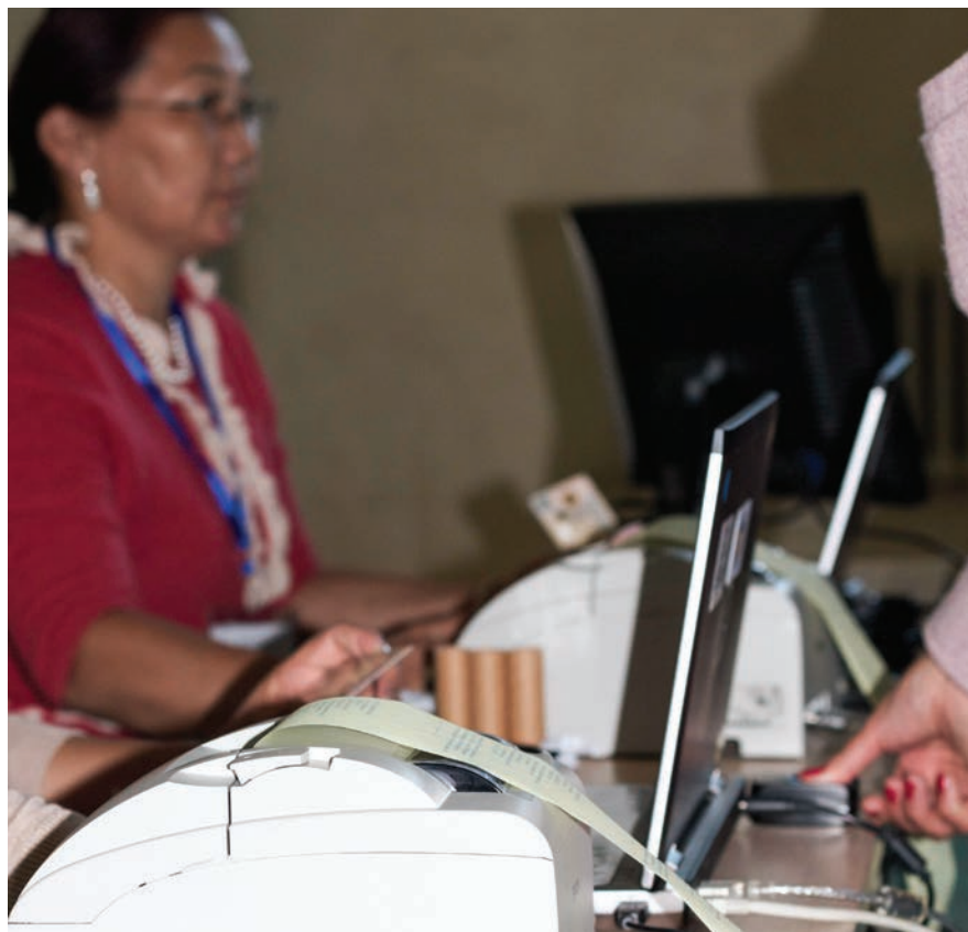
Izborni službenik izdaje potvrdu za glasanje biraču u Kazahstanu, 2005. godine