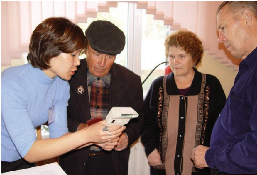
Izborni službenici pokazuju novu tehnologiju glasovanja biračima u Kazahstanu, 2004. godine