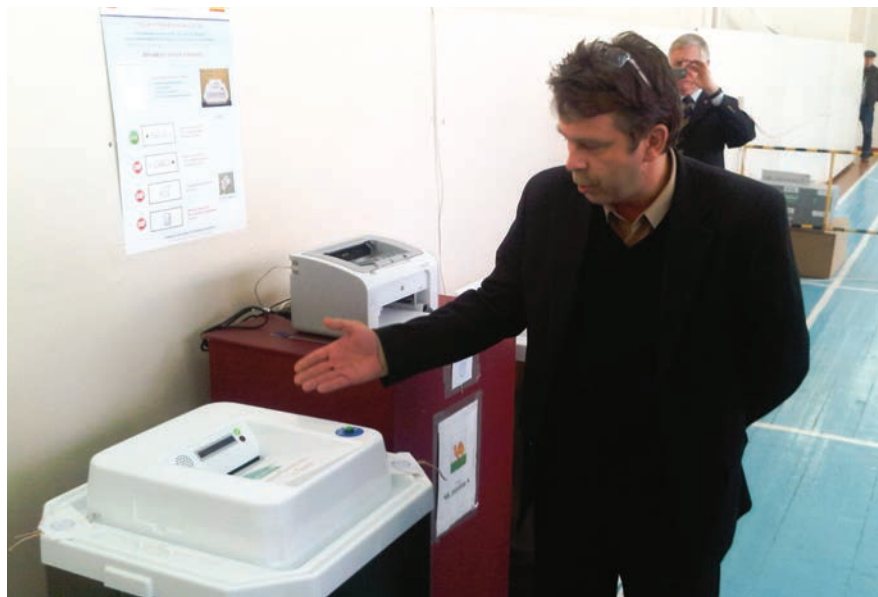
Izborni službenik pokazuje tehnologiju skeniranja glasačkog listića u Ruskoj Federaciji, 2011. godine