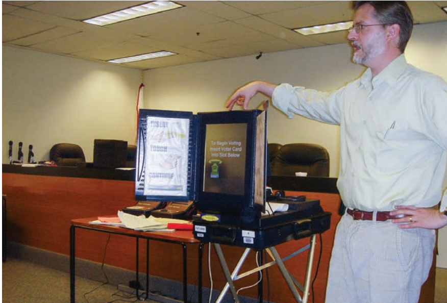
Izborni službenik obučava izborne administratore kako koristiti strojeve za elektroničko glasovanje s izravnim snimanjem u Sjedinjenim Američkim Državama, 2006. godine