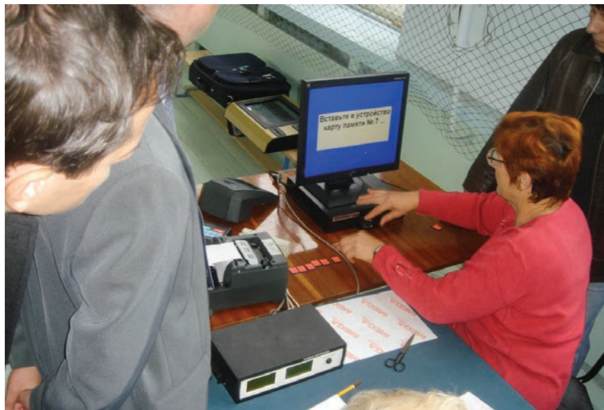
Promatrači prate prikupljanje rezultata glasanja u Ruskoj Federaciji, 2006. godine